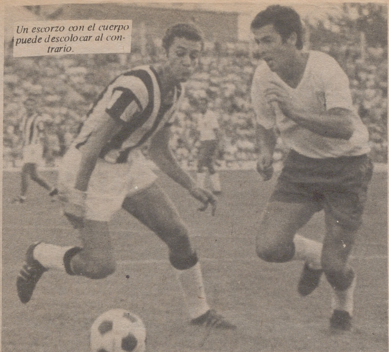
Un escorzo con el cuerpo puede descolocar al contrario.

D ESPUES de haber pasado revista a toda la técnica del fútbol, desde el «dribbling» al tiro, pasando por el pase, el juego de cabeza, los métodos para amortiguar el balón, etcétera, hoy estudiaremos las diferentes fintas, del cuerpo, pie o cabeza.