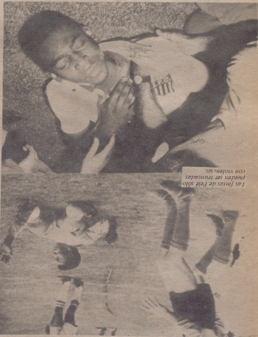
Las fintas de Pelé sólo pueden ser truncadas con violencias.