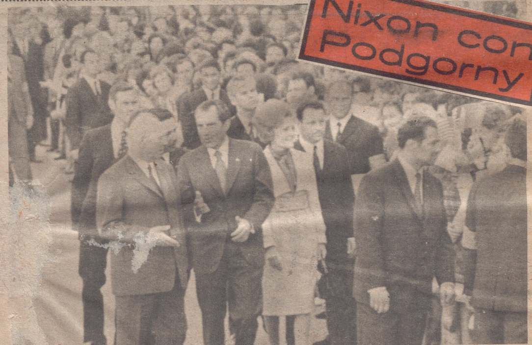
Nixon con Podgorny

● "HAY QUE DECIDIR SI QUEREMOS IR AL MERCADO COMUN A OIR MISA O A DECIRLA (Pág. 15)