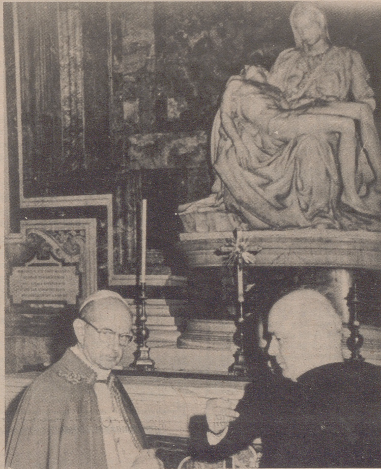
CIUDAD VATICANO.— El Papa Pablo VI aparece con expresión disgustada cuando inspecciona los daños causados a la obra escultórica de Miguel Angel "La Piedad" por el geólogo húngaro Laszla Toth de 33 años quien golpeó a la estatua con un martillo. Laszla fue inmediatamente arrestado.