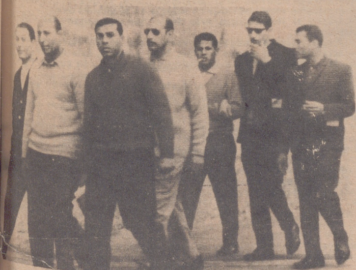
LA VALETTA.— Técnicos libios fotografiados en Malta el pasado domingo a su llegada a la isla. Era la primera aparición que hacían en público.— (Foto Ap-Europa Press)