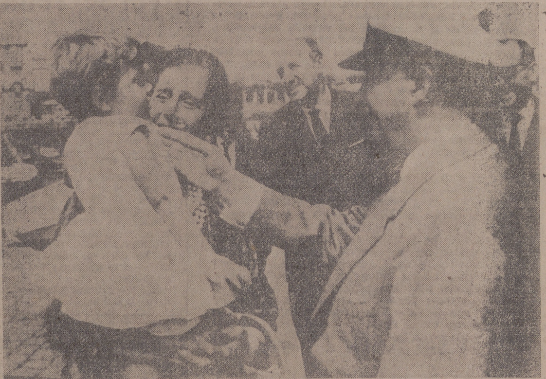
LA CORUNA.—Al llegar al Real Club Náutico, Su Excelencia saluda a una niña, "escapada de la vigilancia de sus padres", la que sostiene su esposa, doña Carmen Polo de Franco.