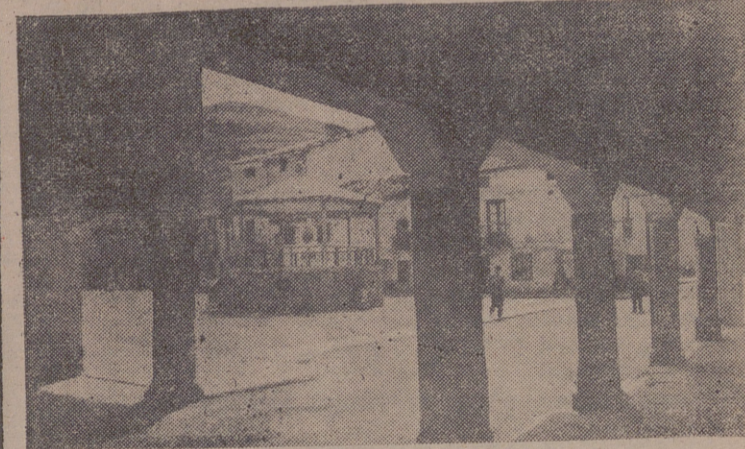
Plaza del Conde de Torremuzquiz, en Ezcaray.