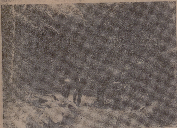
Los bosques ezcarayenses ofrecen este compacto y umbrío aspecto. En primer término, obreros abriendo un camino a su través.