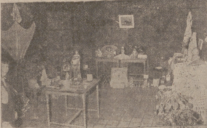
Un detalle de la exposición de los objetos entregados por los oyentes para la pequeña subasta de Radio Juventud de Calahorra.