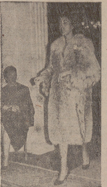
Elegante abrigo de pelo largo, presentado por «Emanuel».

MODELOS ALTA COSTURA Victoria, 37. 2.º y TH 2561