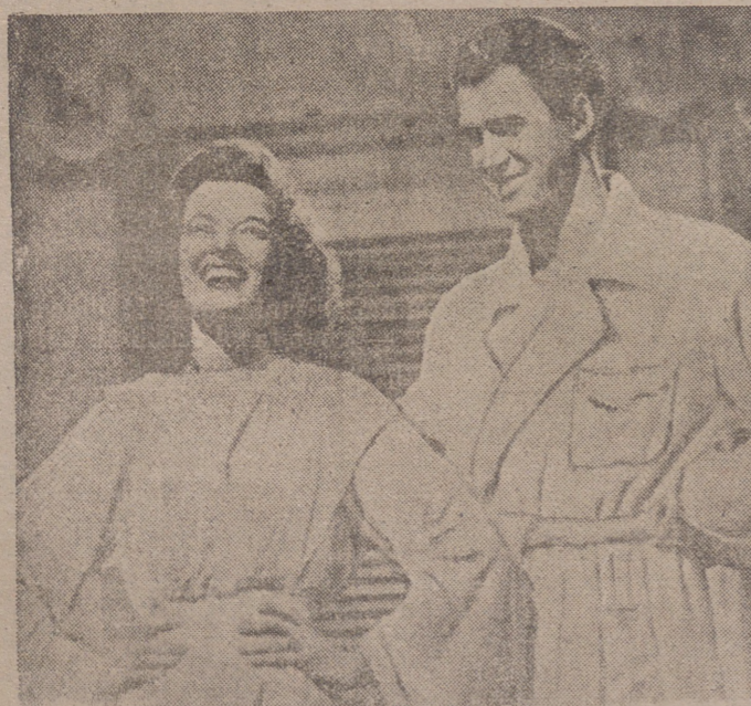
Auth Hussey y James Stewart ríen satisfechos no sabemos de qué, porque desconocemos la trama argumental de la cinta a que pertenece esta escena, una de las más recientes interpretaciones de la nave.