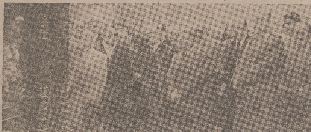
El ministro del Aire, señor González Gallarza; el de Marina, Sr. Moreno; el alcalde de Madrid, y otras autoridades, en la presidencia del duelo durante el entierro de los aviadores que perecieron en el accidente ocurrido en la «Majada del Chacho».