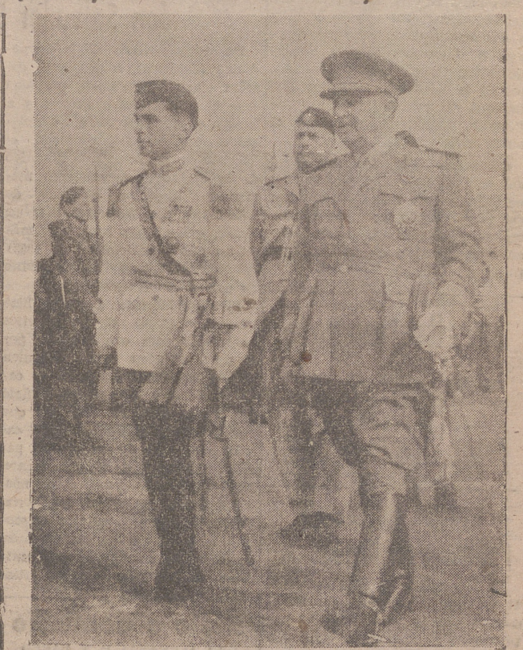
MADRID.— El rey Hussein de Jordania, acompañado de S. E. el Jefe del Estado, Generalísimo Franco, pasa revista a las fuerzas que le rindieron honores a su llegada al aeropuerto de Barajas.

Ante el edificio del Museo se había congregado una gran multitud de público, que renovó las cariñosas manifestaciones de simpatía a los reyes de Jordania, ovacionándoles largamente.