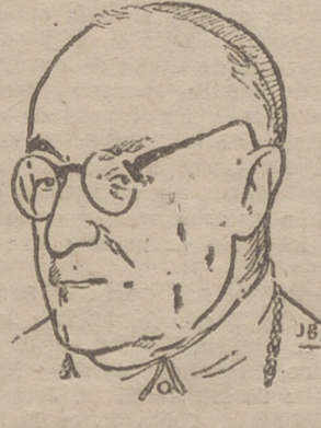
CARDENAL PLA Y DENIEL, LEGADO PONTIFICIO

ZARAGOZA, 7.—En el altar mayor de la basílica del Pilar, cuya imagen lucía toda la plata de su tesoro, se ha celebrado a las diez de la mañana la misa del Espíritu Santo del Congreso Mariano. Ofició el cardenal arzobispo de Sevilla, doctor Segura, quien fué recibido en la puerta del templo por el cabildo catedralicio en pleno. Después del Evangelio, el cardenal pronunció una elocuente plática para subrayar la importancia del Congreso mariano y deseando que sus frutos espirituales sean todo lo importantes que es necesario en los momentos críticos que atraviesa el mundo.