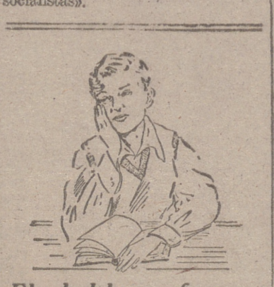
El doble esfuerzo de estudiar a la par que crecer

que en el extranjero se siguen las cosas de España. A través de mis relaciones con los medios financieros —ha añadido el conde de Marsal—, he podido apreciar que hoy consideran a España como una buena inversión para sus capitales por su segura política de paz, por su espíritu de trabajo y porque sabe convertir en realidades los proyectos. Recuerden también que si España defiende en todo momento su independencia, cumple siempre sus compromisos, aun con sacrificio si es preciso. Finalmente, y como resumen de su entrevista con los medios financieros de los Estados Unidos, dice: «Que la cotización de España, en la Bolsa Internacional de los países es cada día más alta. Nada hay más temeroso que el dinero, pero tampoco hay nada como el dinero que adivine ante la seguridad de un lugar donde poder crear. Y ahí está el dinero de muchos países americanos o no, deseados de venir a España, porque adivinan que es hoy un lugar seguro, tranquilo y en manos de buenos patriotas y buenos trabajadores, sin preocupaciones socialistas».