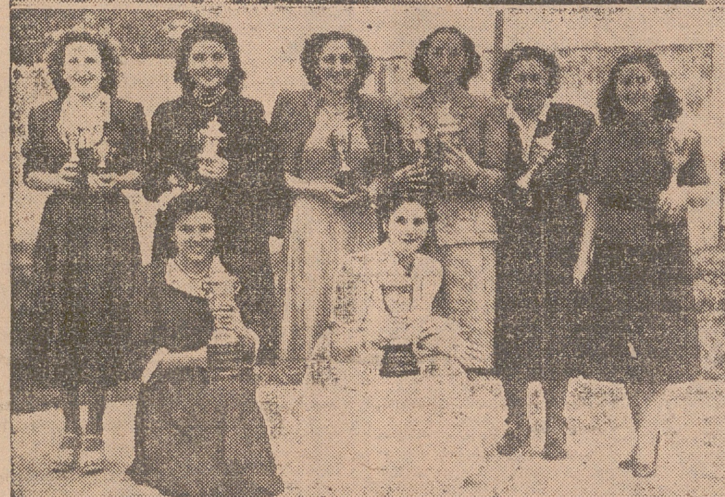
GRUPO DE VENCEDORES UN MOMENTO DEL REPARTO DE PREMIOS SENORITAS PARTICIPANTES QUE OBTUVIERON TROFEOS (Fotos y grabado, Cortés Payá)

el señor Escobés y el señor Lasanta. TIRADA ESPECIAL DE NEOFITOS A PISTOLA Y FUSIL Estas tiradas han sido ganadas por el señor Arpón y el señor Nequeruela.