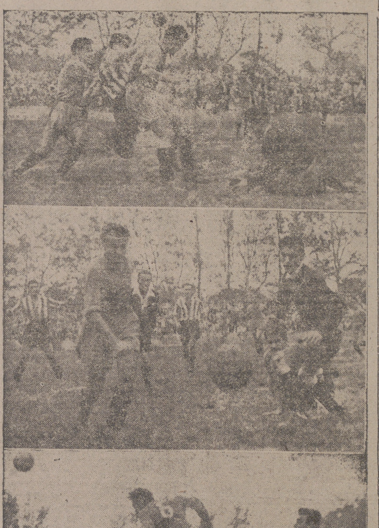
Vélez bloea protegido por la defensa. — Un balón que parece ir a gol, pero que no va. — La defensa de Zaragoza corta un centro de cabeza. (Fotos y grabado, Cortés Payá)