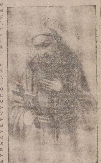
Figura prócer la de Francisco de Asís, agotadora de historiadores e hipereróticos, amasada en fuego y saturada de idealismos sublimes, que los prudentes juzgaron imposible. Su aparición fue la de un cometa extraño que llegaba de horizontes desconocidos, paseando su cabellera luminosa ante el sobresalto y la admiración de las gentes.

Repetir en toda su realidad emocionante a doce siglos de distancia y en medio de un mundo en el que, sobre concepciones viejas y gastadas fermentaba la reforma, el paso de Jesucristo por la tierra, con su vida errante de pueblo en pueblo como peregrino que pasa sin detenerse: con su mezcla de humano y de divino, enseñando con el ejemplo más que con la palabra a los eternos hablados de cosas espirituales y recordando a los hombres que hay cosas más serias y más altas que correr justas, mirar a la tierra y cantar a las damas. Anormal, desequilibrado... y lo era, como lo es todo el que se levanta sobre la línea que señala el nivel del vulgo, lo que sale del camino que marca el andar de los rebaños, lo que rompe los moldes en que se troquelan las mayorías anónimas. Para dejar huella en la historia y destacar el propio relieve por algo que los demás no han tenido la capacidad de concebir ni el valor de realizar, es necesario quebrar la fúrpida sin nombre que cubre el sepulcro del soldado desconocido.