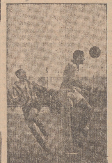
Un buen despeje de Lanza.

Según nos informan, con motivo de las cercanas ferias de ganados en nuestra capital, la empresa del Frontón Beti Jai tiene el propósito de celebrar esos días grandes partidos de pelota. A medida que nos vayan dando las combinaciones, todas a base de primeras figuras, las iremos publicando para conocimiento de los aficionados. Según nos dicen, en el programa no faltará la inclusión del excelente jugador de Baños Barberio.