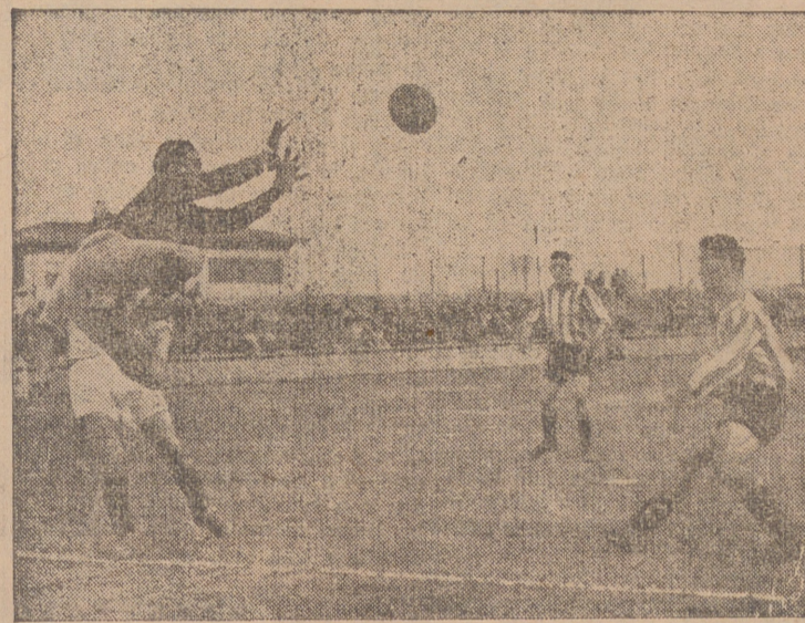
Pipó realiza una magnífica estrada para bloquear un balón que iba a la red.

De los componentes de la zaga sí que puede decirse que cumplieron con su deber, pues Pipó hizo algunas paradas francamente buenas; Oyón y Sosa hicieron el marcaje bastante aceptablemente, y Lanza, que tuvo un fallo de esos escalofrantes, se encontró con un Balzagui que dió sensación de poca movilidad y pudo revolverse a tiempo para estorbar un remate que hubiera sido el primer tanto para los alavésistas. Después se aseguró al cuarteto defensivo no puede hacerse responsable de la derrota, pues el único tanto que se marcó lo logró el Alavés a los 22 minutos de la segunda mitad por mediación de su interior Badají, no sin antes ayudarse, un poco con la mano, detalle que no pudo captar el árbitro a pesar de que estaba cerca, por la razón de que estaba