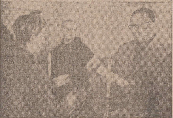
Arriba: El Excmo. Sr. gobernador civil y jefe provincial del Movimiento dirige la palabra a las jerarquías de la Sección Femenina y a las nuevas divulgadoras sanitarias.