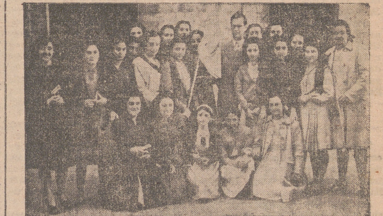
Grupo de aspirantes de Acción Católica con el banderín bendecido momentos antes en la Imperial Iglesia de Palacio (Foto y grabado Cortés Payá)

Logroño vivió el jueves intensas horas de fervor eucarístico, participando con recogimiento en la más española de las festividades de que tan rica es la liturgia en la Iglesia católica, y que año tras año, desde su implantación en el año de 1261 bajo el pontificado de Urbano IV, ha venido celebrando España con creciente esplendor.