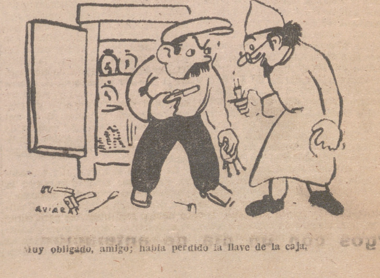
—Muy obligado, amigo; había perdido la llave de la caja.