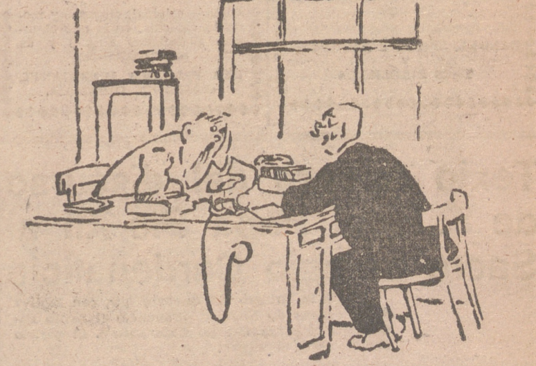
—En cuanto meto una pierna en la cama, me quedo dormido. —¿Y cómo te las arreglas entonces para meter la otra pierna?