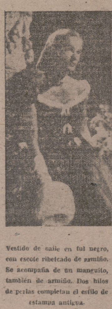
Vestido de baile en tul negro, con escote ribetado de amarillo. Se acompaña de un manguito, también de amarillo. Dos hilos de perlas completan el esbozo de estampa antigua.