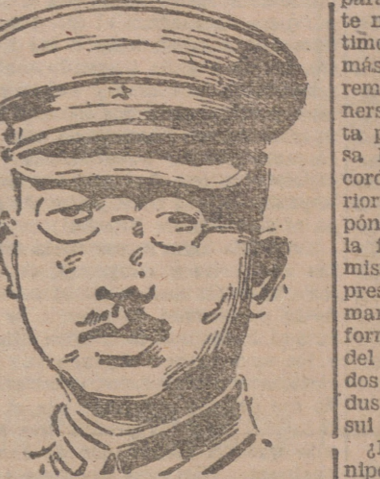
La situación en Moscú depende de la postura que adopte el Kremlin en esta cuestión.

Con asistencia del ministro de Educación Nacional ha abierto sus puertas el Museo Romántico, que constituye el recuerdo de nuestro romanticismo y guarda en sus salones un siglo entero de historia.