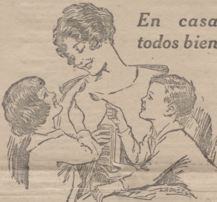
En casa todos bien