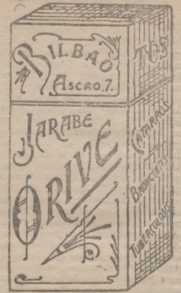
EL MEJOR remedio para EL PEGOR catarro, Jarabe Orive. Precio, 4'25 ptas

Grandes surtidos en artículos de Paquetería, Mercería y similares