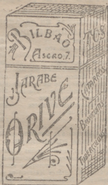
EL MEJOR remedio para EL PEAR catarro, Jarabe Orive. Precio, 4/25 ptas

Grandes surtidos en artículos de Paquetería, Mercería y similares