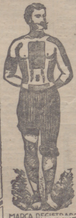
MARCA REGISTRADA EXIGIDA EN LA CUBIERTA DE CADA EEMPLASTO