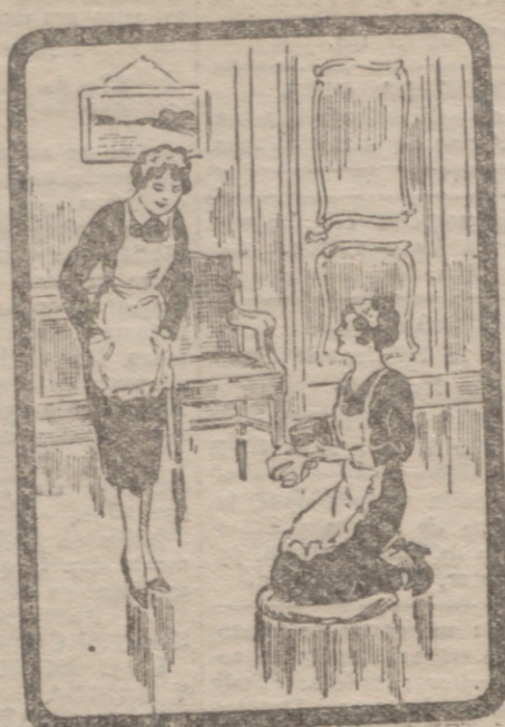
DA GUSTO VERLAS

Estos accidentes tan repetidos y casi siempre de tan tristes consecuencias, se evitan empleando el Encáustico ALIRON, que, además, resulta más económico.