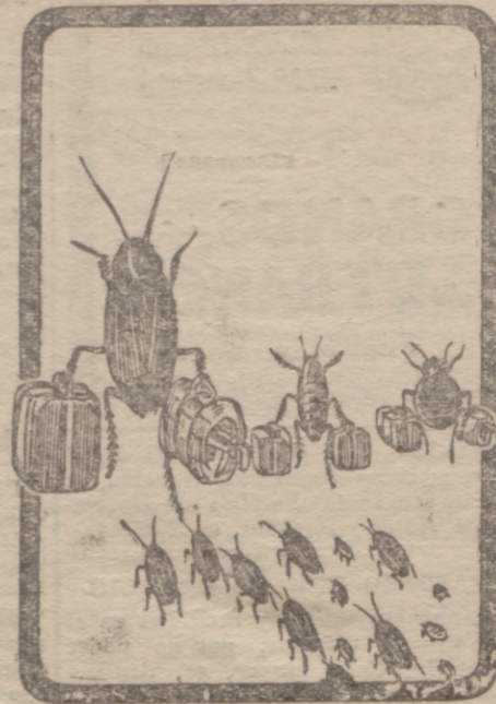
TIENEN QUE EMIGRAR

Porque ahora no les vale refugiarse en los intersticios y agujeros. El Encáustico ALIRON, aplicado a muebles y suelos, acaba con pulgas, chinches, cucarachas y demás molestos y repugnantes bichitos.