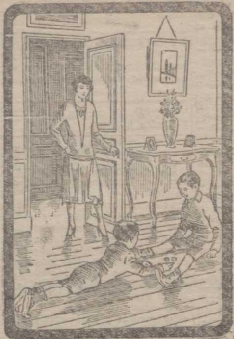
¡QUE CHIQUILLOS ESTOS!

¿Pero dónde habéis visto vosotros que los niños bien educados se tumben en el suelo?