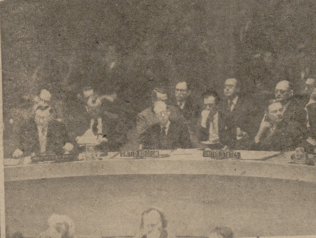
Tardamente, pero con entera dignidad, España forma parte de la Organización de las Naciones Unidas. Nuestros lectores conocen los detalles de este acto, en el que, salvo Bélgica, todas las grandes potencias se encontraron a nuestro lado. La fotografía reproduce el momento en el que el delegado soviético aboga por el ingreso en bloque de todos los países. Minutos después, China nacionalista vetaba a Mongolia; horas más tarde, en un rápido viraje, España era admitida en la Organización.