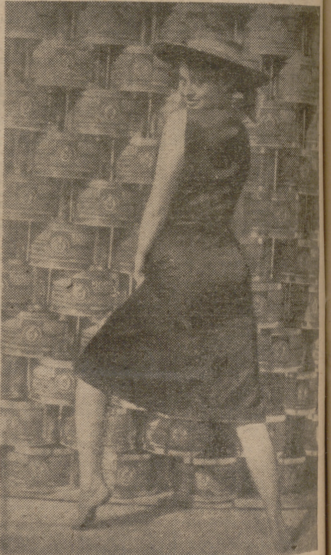
Sofia Loren, luciendo todo el esplendor de su belleza y de su arte, en una de las creaciones que han hecho de ella la actriz que promueve tumultos de admiración en torno suyo.

Les fueron ocupados pasaportes perfectamente falsificados, así como los útiles necesarios a sus ilícitas actividades y determinada cantidad de dinero, siendo puestos todos ellos, en unión de las diligencias instruidas, a disposición de la autoridad judicial competente."