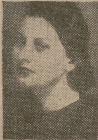
Sofia Loren a los dieciséis años, cuando obtuvo el segundo premio en un concurso de belleza y aún no soñaba con ser una estrella sensacional de cine.

Después de dura lucha, se ha convertido en la actriz más admirada