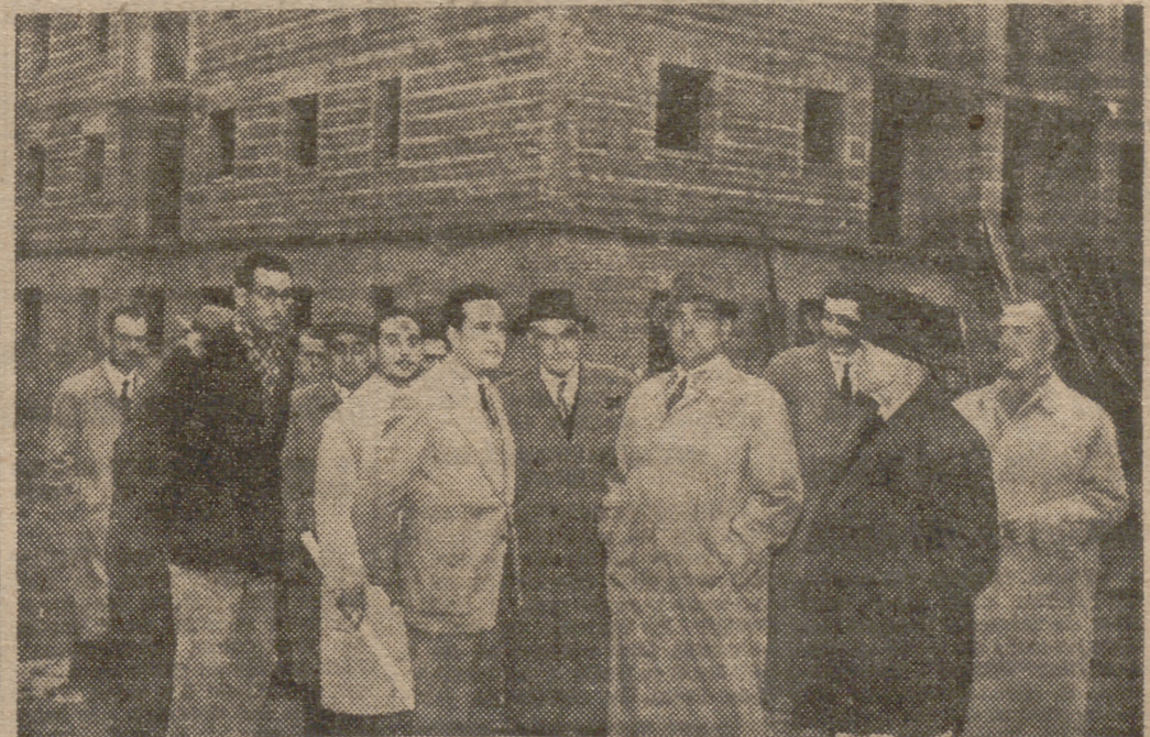
El delegado nacional de Sindicatos, acompañado de diversas jerarquías sindicales madrileñas, visitó ayer la barriada de Puerta Bonita, en donde se construyen cuatrocientas viviendas mediante la prestación personal de sus futuros inquilinos. Sobre esta interesante fórmula de construcción de viviendas por los propios interesados publicaremos próximamente un reportaje.