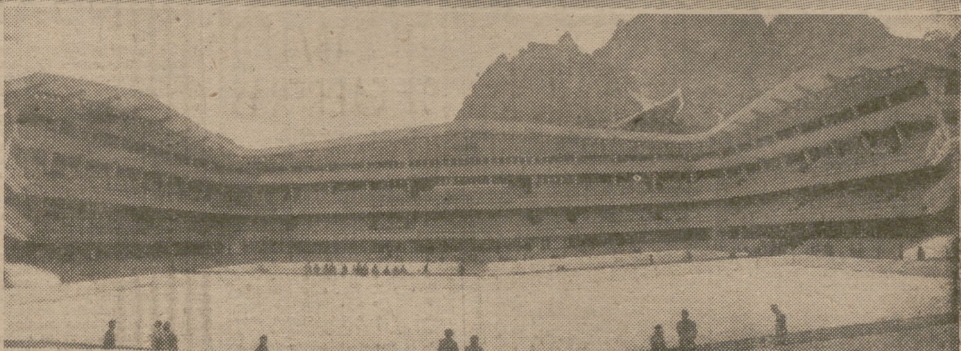
Una vista del nuevo Estadio de Ghiaccio, capaz para 12.000 espectadores, que ha costado 80 millones de pesetas, y en el que se disputarán los Campeonatos mundiales de hockey sobre patines y patinaje artístico.

En Cortina D'Ampezzo se han construido 12 instalaciones deportivas valoradas en trescientos sesenta millones de pesetas