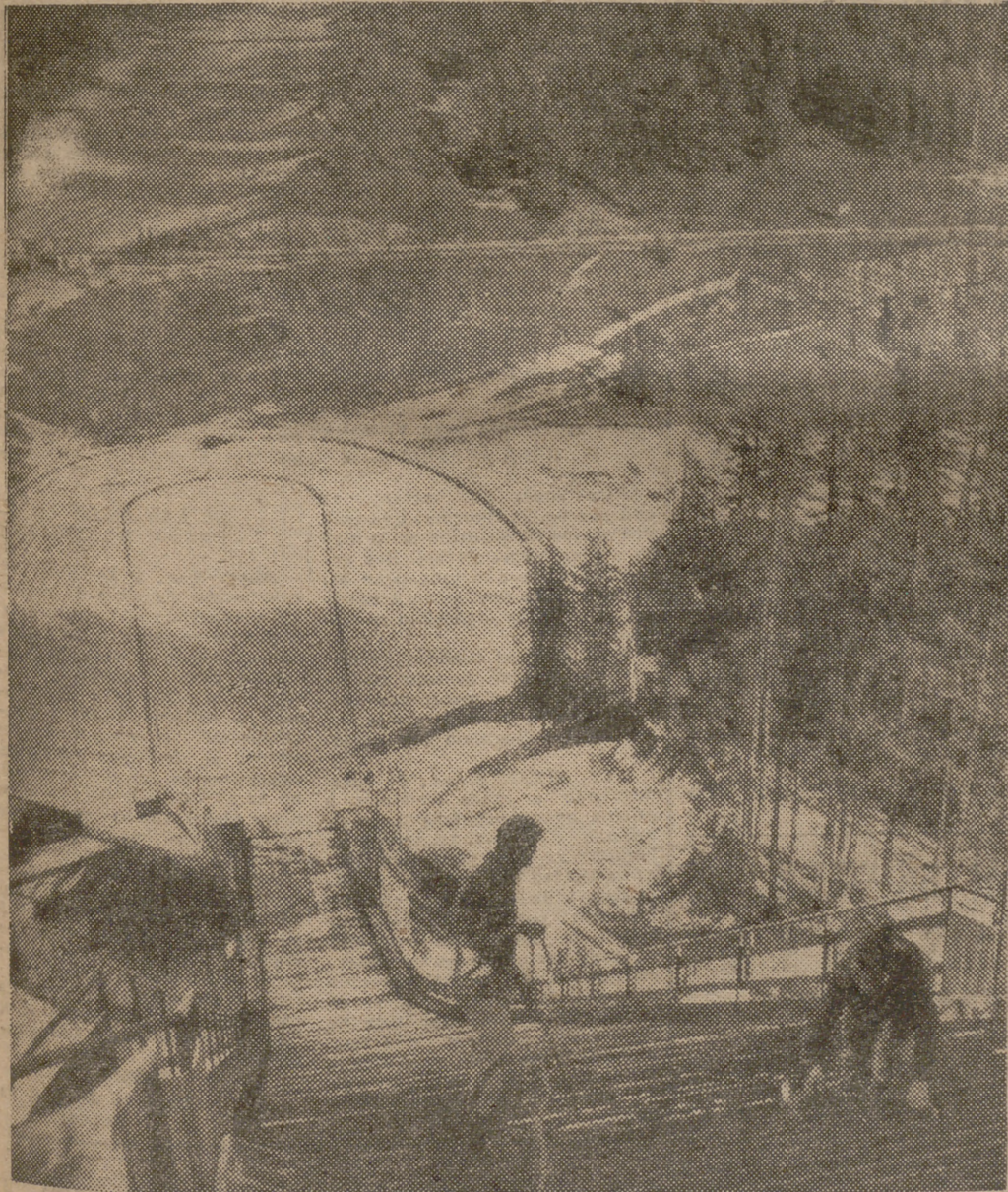
Fotografía obtenida durante los trabajos en la parte alta del trampolín de saltos, construido sobre cemento y acero, con un costo de casi veinte millones de pesetas.