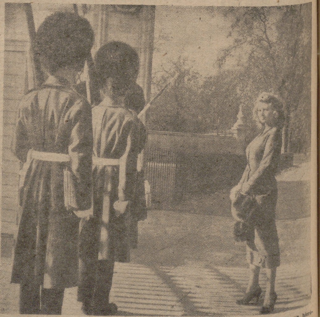
Sofia Loren se enfrenta con la guardia de Buckingham Palace. Los granaderos pasan hierros, torturados por una disciplina que les hace fijar la mirada veinte pasos al frente, sin poder mirar, ni tan siquiera con el rabillo del ojo, a esa flor que, inesperadamente, brota del estofado londinense.

El acuerdo de conmutación de la pena capital fue adoptado en el Consejo de Ministros celebrado el pasado día 2. (Cifra.)