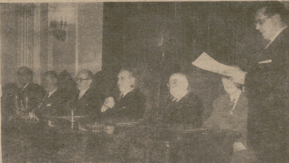
El ministro de Justicia, señor Iturmendi, acompañado de diversas personalidades, preside, en el salón de actos del Instituto de Estudios Jurídicos, la inauguración del presente curso de conferencias.

el más puro y santo amor a España, moris, no importa; ese es vuestro deber.