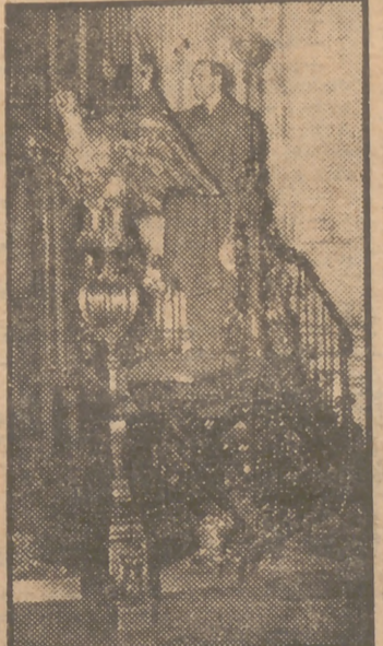
Un individuo colocado en el púlpito de la Catedral de San Pablo (Londres) dispara una pistola al aire. No se trata del acto de un sacrilego, sino de una experiencia acústica realizada con motivo de la instalación de un nuevo sistema de altavoces en la Catedral.