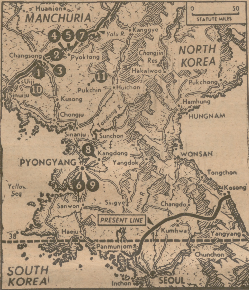
Este mapa, distribuido por la Associated Press, señala los once campos de prisioneros de la Corea del Norte, donde los Comunistas encerraron a los soldados aliados que cayeron en sus manos, según indicó un portavoz del Mando de las Naciones Unidas el 18 de diciembre último. Los campos están situados entre Pyongyang, la capital nortista, y las riberas del Yalu, en las fronteras manchurianas.