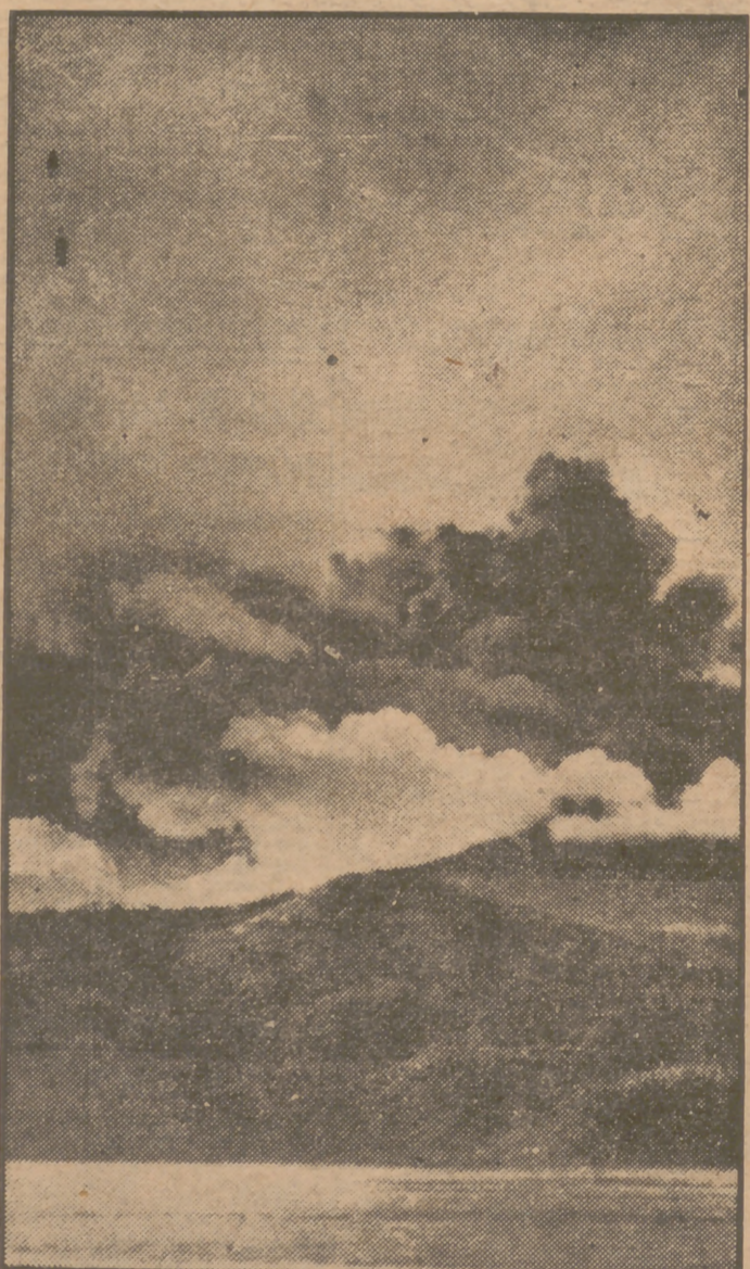
La enorme masa de humo la vomita el volcán Hibok Hibok, en la isla filipina de Camiguin. Los muertos a causa de la erupción suman 266, a los que hay que añadir, según cálculo, unas 500 víctimas más que se suponen enterradas en la lava.