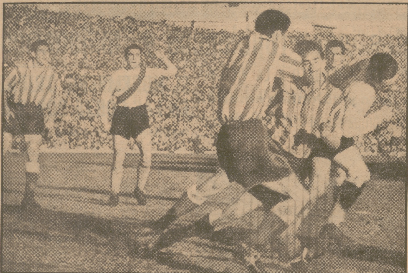
Esto que ven ustedes aquí no es, como parece, un paso colectivo "Bugi-bugi" a los acordes de la estruendosa música del "jazz-band", sino un momento del emocionantísimo partido que ayer jugaron sobre el humedo césped del Metropolitano el Atlético de Madrid y el River Plate. La pareja que se disputan los gesticulantes, contorsionados y supuestos danzantes es el cuero, prosaico y foo, pero imprescindible para escalar la dorada meta de la victoria. El fútbol, en su propia, tiene a veces dramatismo y otras comicidad.

(Amplia información del encuentro en las páginas interiores.)