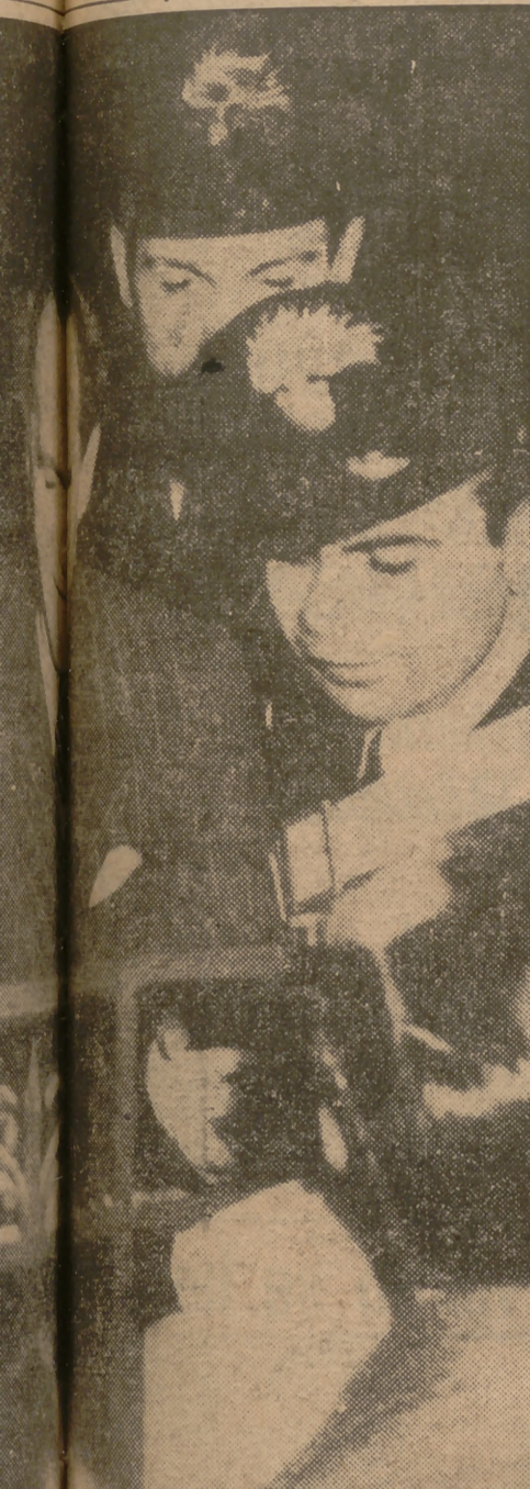
En 1938 como presunto complicado en el asesinato de un senador... En 1941, Grande fue condenado a veinticuatro años de prisión... El Tribunal Supremo de Italia lo absolvió... Grande ha pasado once años en prisión...