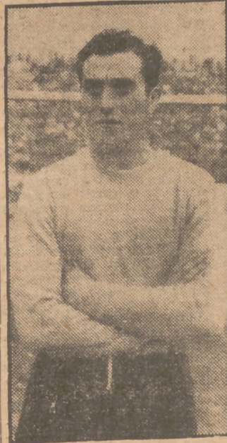
Y Carrizo, el fenómeno criollo, a juicio de propios, ex- traños... y del público.

La verdad es que entre los at- léticos no había demasiado disgus- to por el empate. Tal como se ha- bían puesto las cosas casi al final, con las lesiones de Silva, Estruch