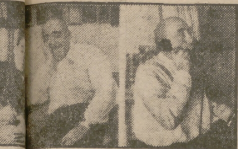
Vittorio de Sica, el famoso guionista italiano, que...