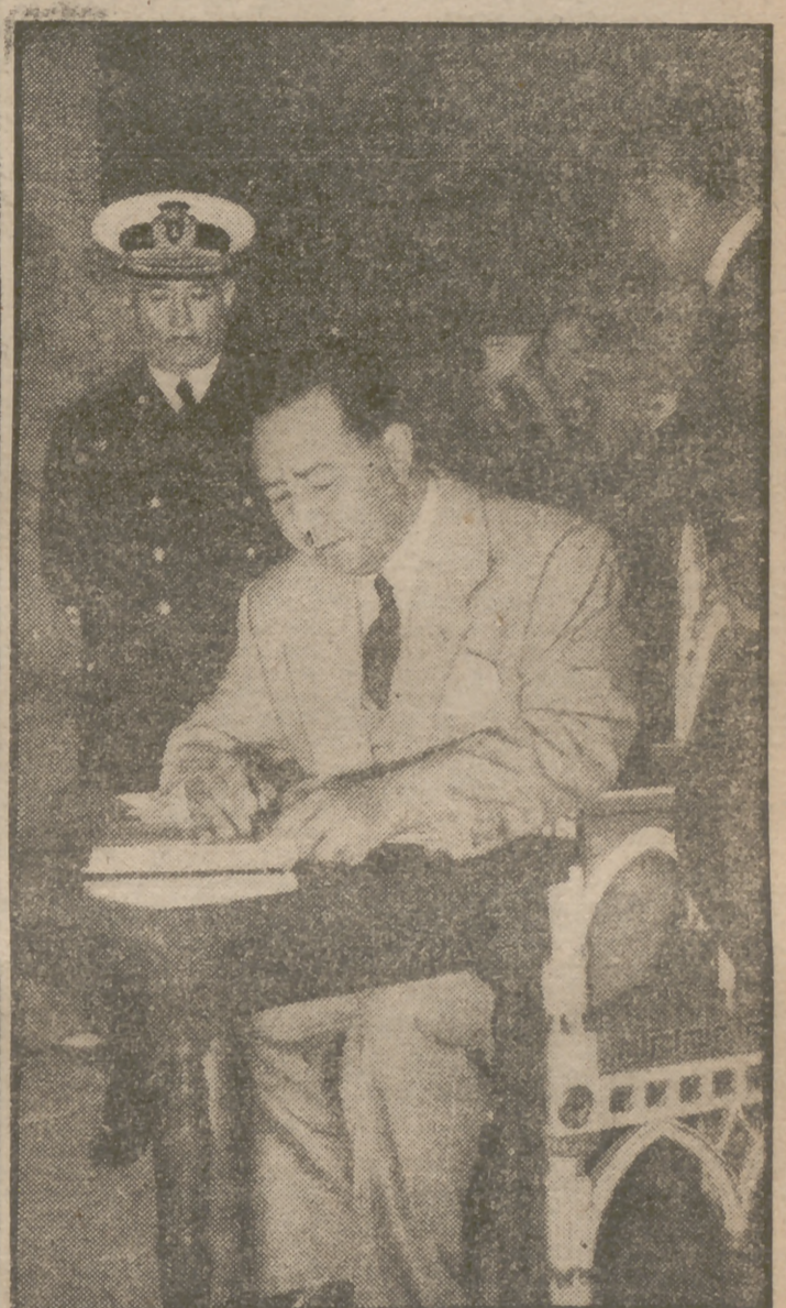
El Presidente de Filipinas, don Elpidio Quirino, acompañado del ministro subsecretario de la Presidencia, señor Carrero Blanco, y otras personalidades, durante su visita al Monasterio de San Lorenzo, firma en el álbum de honor. El Presidente Quirino visitó hoy el Valle de los Caídos, y esta tarde, a las seis, emprendió su regreso a Madrid.