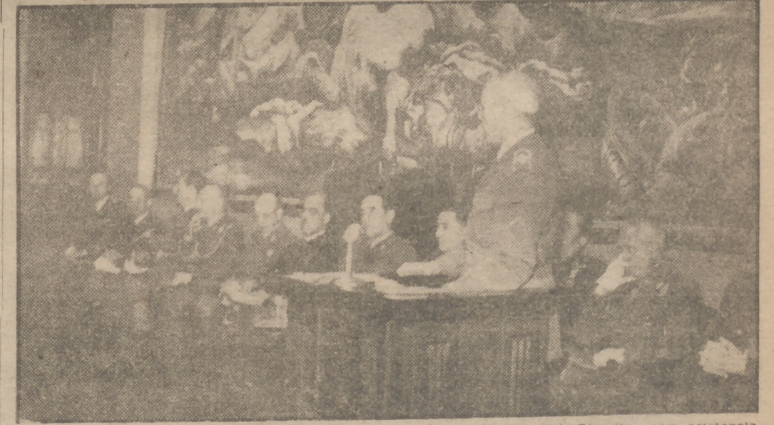
Esta mañana se inauguró el curso en la Escuela Superior del Ejército, con asistencia de los ministros del Ejército, Marina y Aire. Asisten 10 generales y 32 coroneles. El director de la Escuela, teniente general Aensio, pronunció una brillante lección. (Información en página 5.)