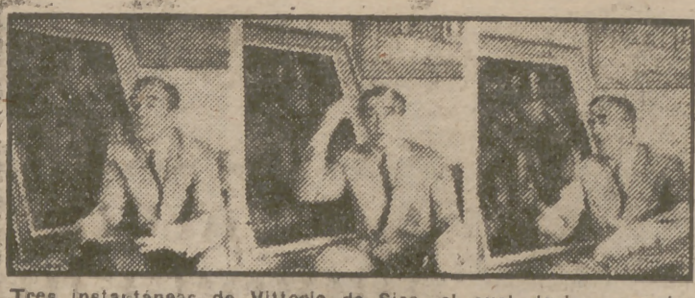
Tres instantáneas de Vittorio de Sica, el cual declara que las películas americanas sólo encierran lecciones para cupletistas...