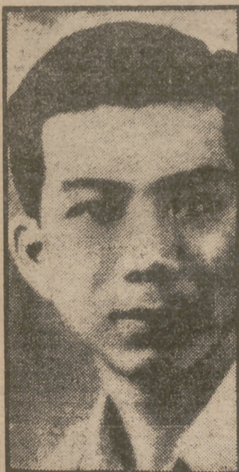
Chan Peng, secretario general del partido comunista malayo y que dirige la campaña terrorista contra los británicos. Ha sido puesto precio a su cabeza: 80.000 dólares de Singapur si se le captura vivo y 50.000 si se le entrega muerto.