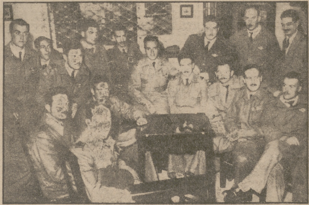
Grupo de militares argentinos que ocasionaron la revuelta que fué sofocada y se internaron en el Uruguay, fotografiados en un club cerca de Carrasco.