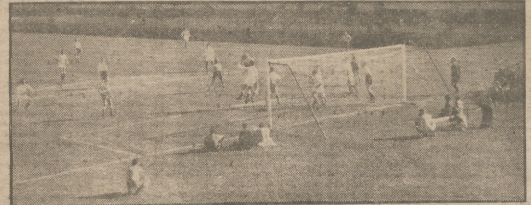
El Estadio Metropolitano volverá a ser mañana escenario del encuentro entre los "eternos rivales" madrileños. La fotografía nos muestra un momento del juego en el último partido Atlético de Madrid-Real Madrid allí disputado.