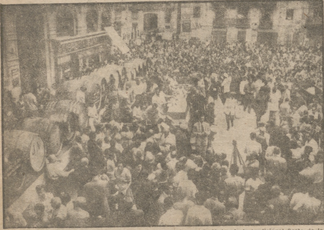
En honor de Nuestra Señora de las Viñas se ha celebrado en Valencia la tradicional fiesta de la Vendimia. Después de la fiesta, las clases productoras ofrecieron pruebas de sus caldos a numeroso público que acudió a presenciársela.