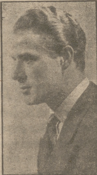
Conrado San Martín, el formidable galán de la pantalla