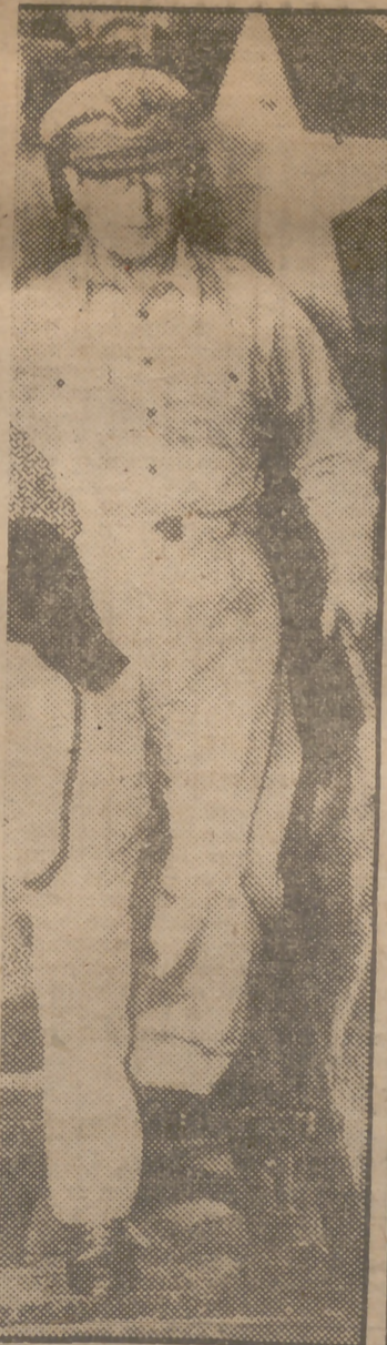
dallas que se ha ganado duramente.

Al aproximarse la alta y elegante figura noté la estrella plateada de un brigadier y la gorra levemente inclinada hacia la derecha. Me cuadré en la clase de saludo que un tormente del Cuerpo Aéreo se supone que debe hacer a un general del Ejército de los Estados Unidos. Había visto y saludado a muchos de ellos durante ese año, sin que me impresionaran particularmente; pero de algún modo éste resultaba diferente. No pude menos de compararle mentalmente con el jefe favorito de los aviadores en esos días, el general "Billy" Mitchell. Ambos caminaban con los mismos largos y graciosos pasos de hombres que saben adónde van y desean llegar allí lo más pronto posible. Ambos eran de la misma altura, más de seis pies, bien acicalados y activos. Ambos parecían llevar sus uniformes, sus gorras y sus botas de modo que mientras el efecto era agradable, uno se preguntaba si se ceñía o no exactamente a los reglamentos. Algunas veces no era así; pero de alguna manera ellos se salían con la suya, con gran complacencia de los oficiales jóvenes, que estaban siempre enloquecidos con la cuestión de "aparición militar" y "respeto a las reglas sobre uniformes". Porque, hubiera o no guerra, tenía que lucir como un soldado en 1918.