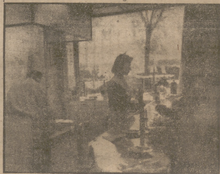
La hora de la merienda congrega en las granjas a los golosos madrileños, que consumen grandes cantidades de nata, frutas y helados. Este es el aspecto clásico del mostrador de una cafetería.