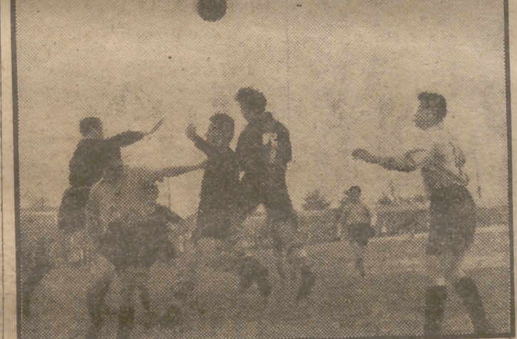
Un momento del partido en el que la defensa forastera, energética y marrullera, contrarresta el ímpetu de la delantera madrileña que no tuvo suerte en sus remates.

En el campo de la Federación se jugó ayer el partido de fútbol correspondiente a la promoción a tercera división, entre el equipo madrileño Cuatro Caminos y el extremeño U. D. Montijo. Venció el Cuatro Caminos por cinco goles a uno, después de demostrar una neta superioridad sobre su rival, al que dominó en los noventa minutos del encuentro. El primer período terminó con la mínima ventaja para el Cuatro Caminos, logrando el tanto su jugador Mariano, y los de la segunda parte fueron conseguidos, dos por Santos, uno por Bermejo y otro por Núñez, defensa éste del equipo madrileño, que, lesionado en la primera parte, actuó en el segundo tiempo de extremo izquierdo.