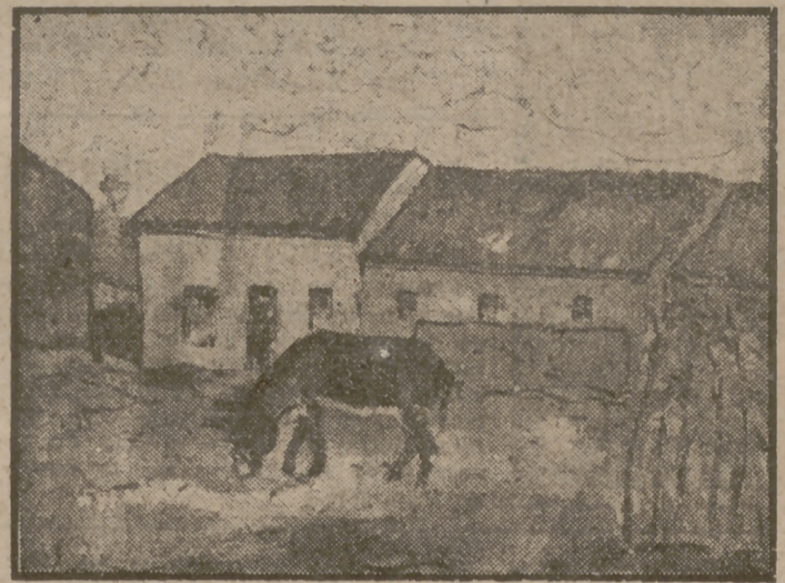
"Paisaje", por Martínez Suárez.