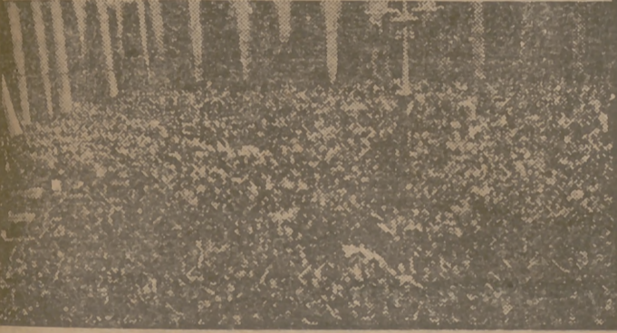
Su Excelencia el Generalísimo Franco durante su visita a la mina "La Camocha", donde inauguró un lavadero modelo. Después de una breve estancia en La Felguera, se reintegró el Caudillo a Gijón, donde se repitieron las muestras de entusiasmo, de las que da idea esta foto de la plaza del Ayuntamiento de dicha ciudad.

LA FELGUERA, 26 (9 m.).—Su Excelencia el Jefe del Estado llegó a esta localidad a las dos y cuarto de la tarde, acompañado de los ministros de Industria y Comercio, señor Suanzes; de Obras Públicas, señor Fernández Regalado. Todo el pueblo aparecía profusamente engalanado. Ante la fachada de la fábrica de la Duro Felguera se hallaba formada una compañía de Regulares, que rindió honores al Generalísimo y que fué revista por éste, mientras la Banda Municipal de Langreo interpretaba el Himno Nacional y el Caudillo era vitoreado y aplaudido entusiastamente por el público.