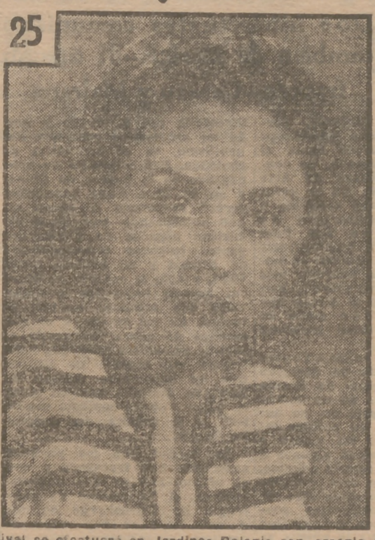
El concurso se efectuará en Jardines Botánica con arreglo al programa que publicaremos en breve.

Publicamos hoy el retrato de la señorita núm. 25, participante en el Concurso El Traje de Cretona. Próxima ya la fecha de 30, en que se cerrará el plazo de admisión de fotos, rogamos a las rezagadas que se apresuren a enviarnos sus retratos para poder participar en el magno certamen. En los primeros días de septiembre se celebrará la magnífica fiesta en que serán presentadas las Reinas de Madrid para que el público elija a la señorita que haya de ostentar el codiciado título de Emperatriz 1949. Este festival se efectuará en Jardines Botánica con arreglo al programa que publicaremos en breve.