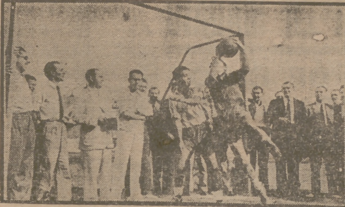
Ha terminado el cursillo de árbitros de España con una lección "práctica", de la que ofrecemos aquí un detalle.