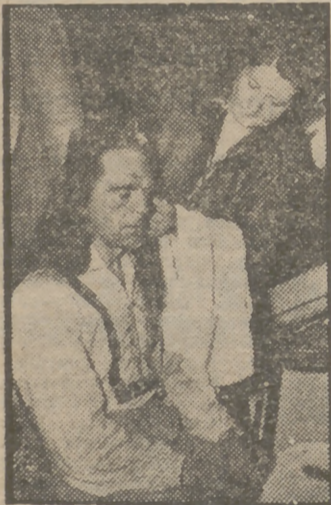
Boris Karloff maquillándose para su papel en la producción de Walter Wanger "Rafael de pasión", que nos presentará Universal-International y que está protagonizada por Susan Hayward y Van Heflin.