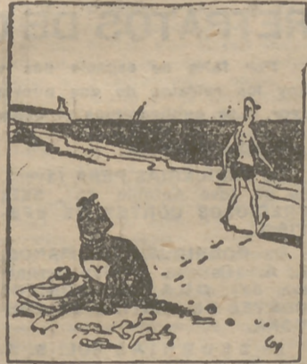
—Y pensar que éste mar- da en mí...

4.000.000 de pérdidas en un incendio en Alicante. (Información en las planas centrales.)