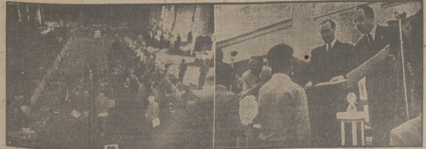
Docientos alumnos de la Institución Virgen de la Paloma, de la Obra Sindical Formación Profesional, han recibido hoy, de manos del Delegado Nacional de Sindicatos don Fermín Sanz Orrio, los diplomas y premios en metálico a que se han hecho acreedores, y que han terminado el curso de preparación para el ejercicio de distintos oficios. (Información en página 5.)