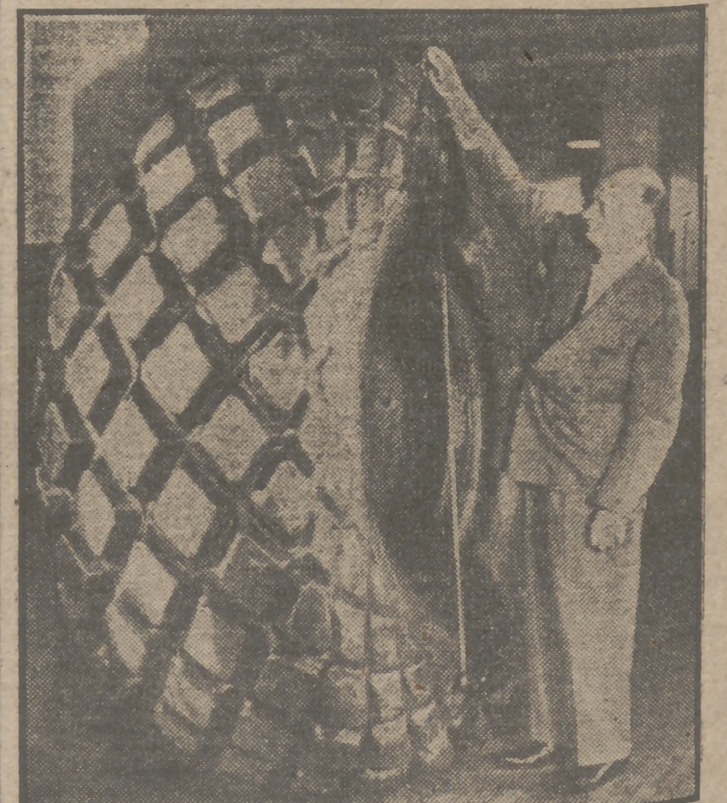
La producción de caucho se ha incrementado considerablemente en todo el mundo.

La puesta en marcha de esta fábrica de fertilizantes a base de nitrógeno mejorará considerablemente los aprovisionamientos del campo cerealista castellano, en cuyo centro se asienta la fábrica.