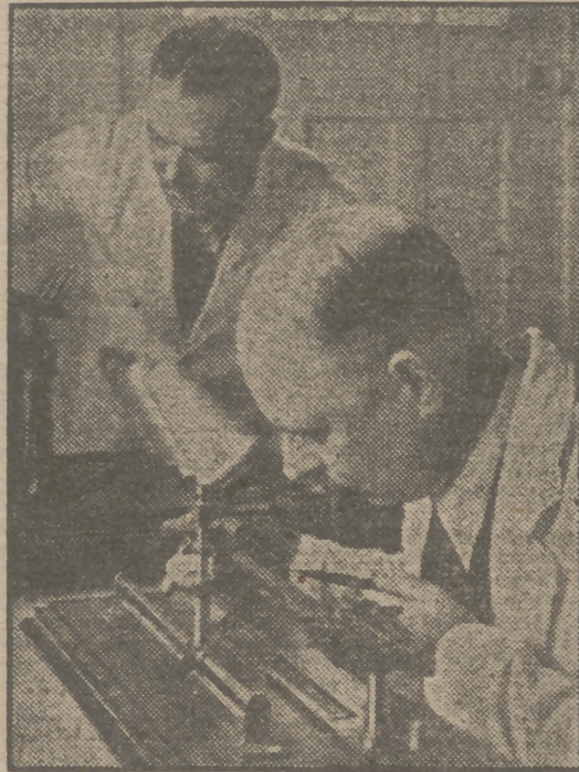
A la derecha se presenta la primera operación de llenar los conos de substancia plástica para que pasen al primer proceso de la fabricación. Y a la izquierda, los ingenieros químicos comprueban en su laboratorio la sutileza y resistencia de una fibra de cristal.