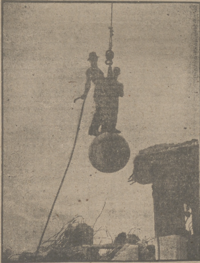
El verano ha hecho acto de presencia en Nueva York con inusitado rigor. El termómetro ha llegado a los 40 grados centígrados, que es mucho llegar. El calor de Nueva York es muy húmedo, y esa temperatura, que ya sería una cosa sería en un país seco, en la gran urbe norteamericana es algo insufrible. En la foto, dos obreros, desnudos de la cintura hacia arriba, trabajan en las obras de construcción del edificio de las Naciones Unidas, en la calle Cuarenta y Nueve, en la orilla del río del Este.