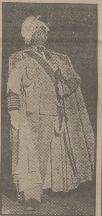
PARIS.—En el Círculo Internacional, y con asistencia del Presidente de la República, Auriol, se celebró "La noche de la Prensa", organizada por los periodistas franceses. Numerosos artistas prestaron su colaboración a esta gran fiesta. En la fotografía, el popular Maurice Chevalier en un momento de su actuación en un "sketch" titulado "Los reyes de la República".