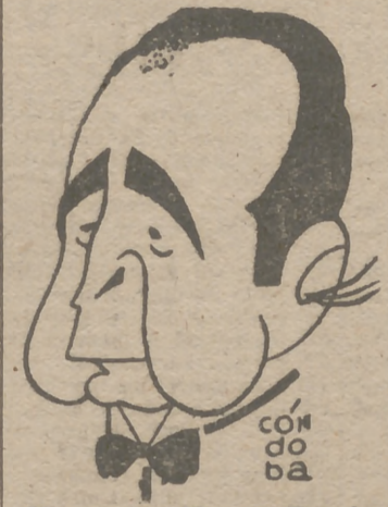
El maestro Moreno Torroba

Con la reposición de esta inspirada zarzuela del ilustre maestro Federico Moreno Torroba, que la notable compañía del aplaudido cantante levantino Antón Navarro efectúa en la noche de hoy en el teatro Madrid, alcanzará gran importante cifra de representaciones la menuda producción musical del famoso compositor.