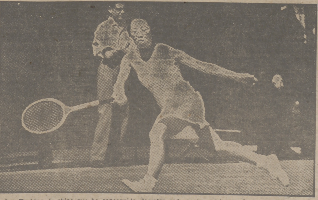
Gen Tozhing, la china que ha conseguido derrotar a la norteamericana Gertrude Moran, la gran figura de los actuales campeonatos mundiales de tenis de Wimbledon. Gen Hoahing actuaba por primera vez en este torneo.