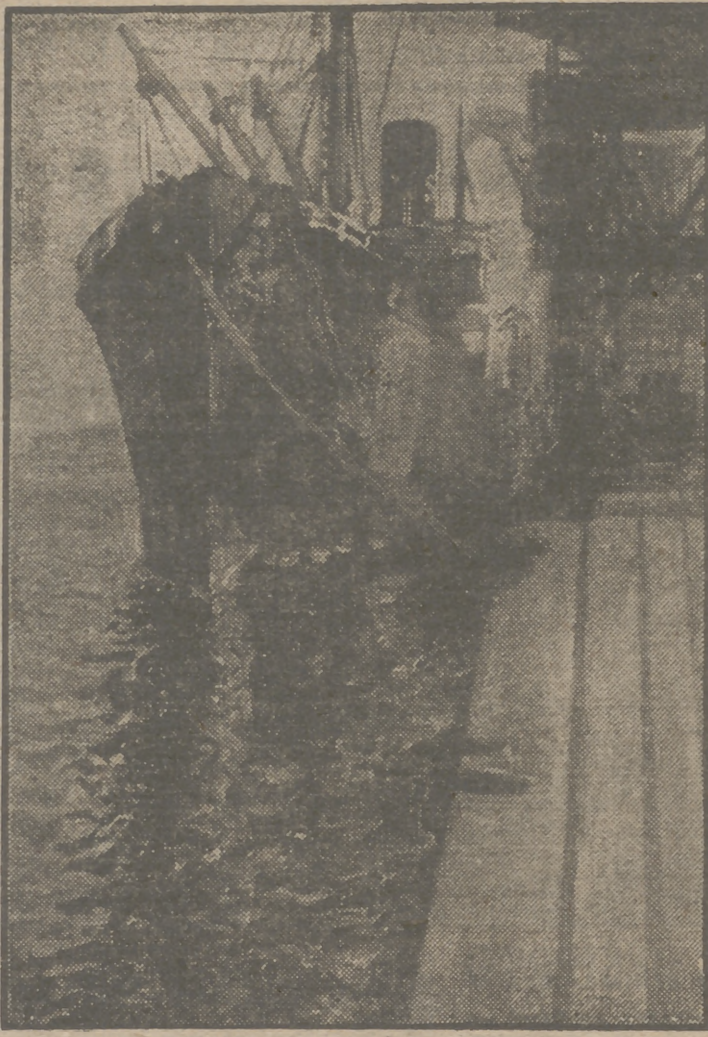
"Marina", de Rodríguez-Puig.