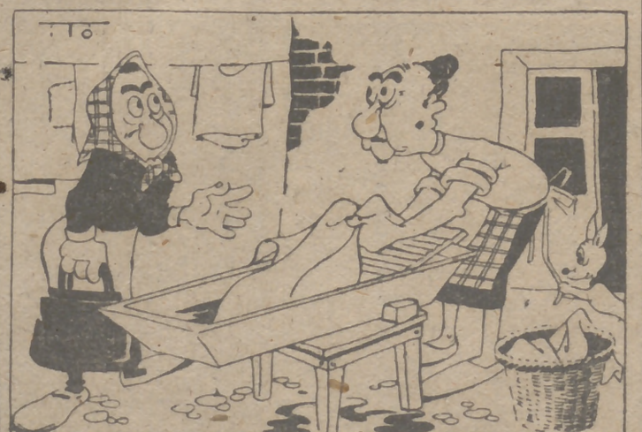
DE VICINDAD, por ITO

—También decía usted que hablaba su chica con un procurador y resulta que es un lechero. —Y es verdad, señora. A ver si no es un procurador... del desayuno.