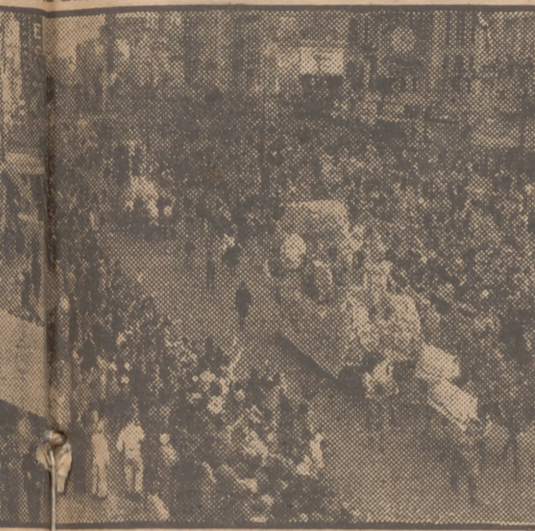
En Nueva Orleans, se celebra con este motivo el desfile de carrozas y máscaras que hace las delicias del público.