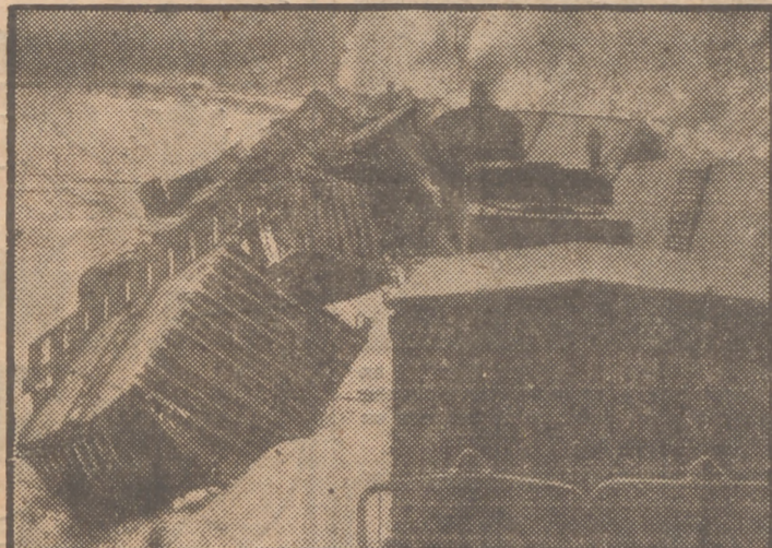
Parte de los veintinueve vagones de la Western Maryland Railway que llevaban grano con destino a las expediciones para enviar a Europa, descarrilaron en Connelville (Pensilvania) el día 30 de enero. La fotografía está tomada a los pocos momentos del accidente.