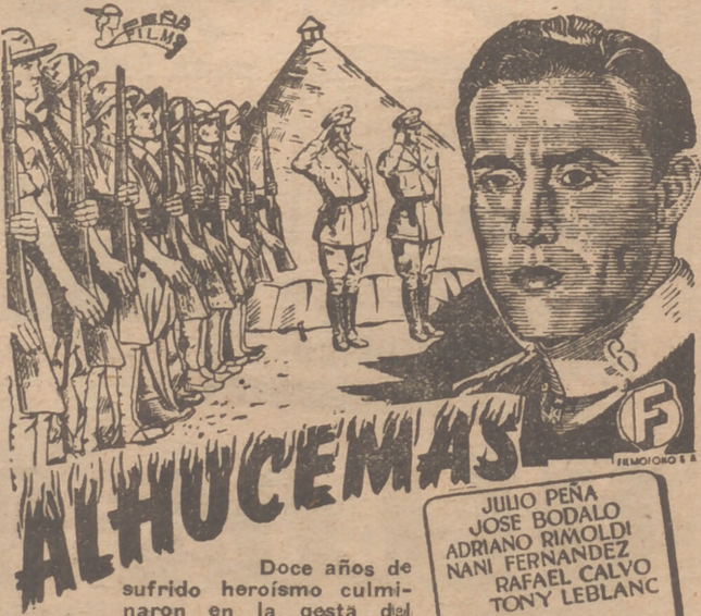
Doce años de sufrido heroísmo culminaron en la gesta del desembarco. Marruecos templó aquellas almas que se moldearon en el Alcázar de Toledo. TOLERADA MENORES

(Patrocinada por la Dirección General de Propaganda) UNA SUPERPRODUCCION ESPAÑOLA FIEL REFLEJO DE UNA DE LAS MAS ALTAS EMPRESAS DE NUESTRA HISTORIA CONTEMPORANEA