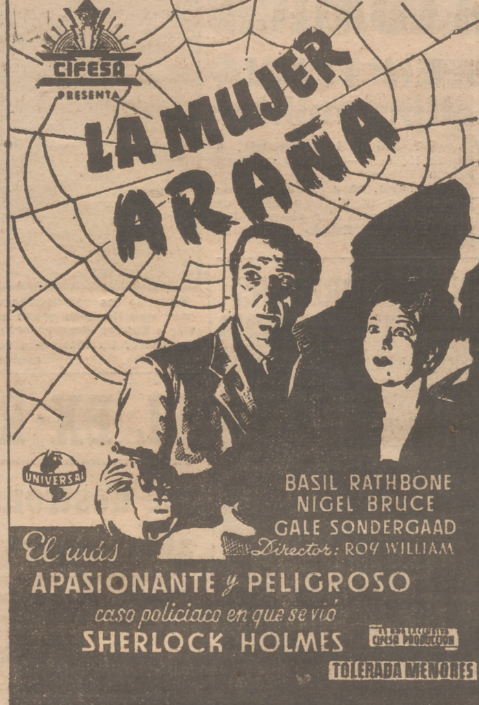
El más APASIONANTE y PELIGROSO caso policiaco en que se vio SHERLOCK HOLMES TOLERADA MENORES