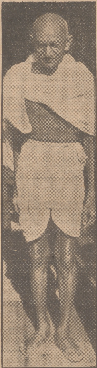
Esta es una de las más recientes fotografías de Gandhi. Un "alma grande" en un cuerpo pequeño. El mahatma pesaba 42 kilos. Con todo pensaba llegar a vivir ciento veinticinco años.

—La nacionalidad—respondió el mahatma—resulta así de lazos de sangre y de raza como por