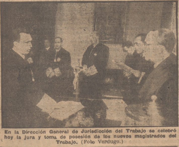
En la Dirección General de Jurisdicción del Trabajo se celebró hoy la jura y toma de posesión de los nuevos magistrados del Trabajo.