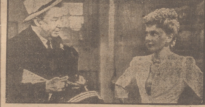
Jean Arthur y Charles Coburn en una escena de "Días Impacientes", el mayor éxito de risa de la presente temporada. Presentada por Edici—la marca de los éxitos—en el cine Capitol, ha sido unánimemente elogiada por la crítica madrileña.

La Escuela-Hogar de Villalata número 5, abre cursos especiales para servicio doméstico de primera categoría, obteniendo la capacitación completa.