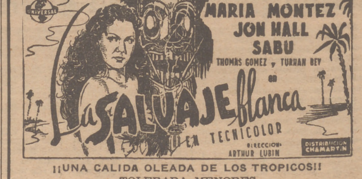
¡UNA CALIDA OLEADA DE LOS TROPICOS! TOLERADA MENORES