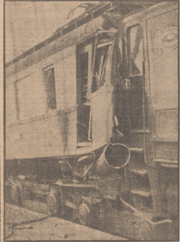
Estado en que quedaron los vagones del correo de Salamanca y Valladolid, empotrados unos en otros, después de chocar con un tren eléctrico, procedente de Villalba, en la estación de Pozuelo de Alarcón.