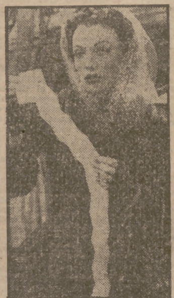
Ivonne de Carlo, la actriz de una belleza sorprendente, es protagonista del magnífico film en tecnicolor "Scherazade", de la Universal Films, y que con gran éxito de público ha entrado en su segunda semana de proyección en el cine Capitol.

deslumbrantes bellezas de Goldwyn. Descuella, naturalmente, entre todos Danny Kaye, en la actualidad el mejor cómico de la pantalla, y le secundan Virginia Mayo, linda como una rosa; Vera-Ellen, consagrada ballarina; Donald Woods, galán que renueva sus laureles, y otras no menos celebradas figuras de la pantalla mundial, y todos ellos dirigidos por ese mago de la realización Bruce Humberstone, que en "Un hombre fenómeno" se ha consagrado como el verdadero maestro del cine moderno.