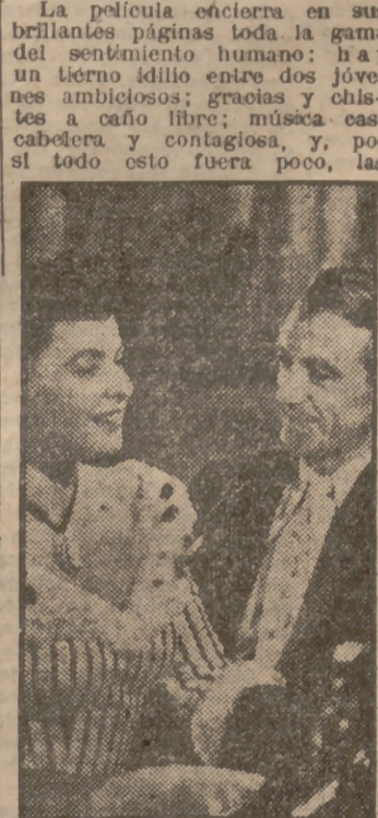
Un trozo del pasado de América, cuando el Mississippi estaba lleno de barro y de piratas. Encarnizadas luchas por la posesión de una línea férrea y deslumbrantes fiestas regidas por la belleza y la elegancia de Olio Dulaine. Nueva Orleans y Saratoga en las postimerías del pasado siglo, a lo largo de un relato de amor escrito por Edna Ferber y vivido en la pantalla por Ingrid Bergman y Gary Cooper, que aparecen en la fotografía que reproducimos de esta excepcional producción que lleva por título "La exótica", y que en breve será presentada por Cepisa.

Exclusivas Moravia presentará muy pronto en un céntrico local el maravilloso tecnicolor realizado por Samuel Goldwyn titulado "Un hombre fenómeno", del que es protagonista el sensacional actor cómico Denny Kaye. La película encierra en sus brillantes páginas toda la gama del sentimiento humano: hay un tierno idilio entre dos jóvenes ambiciosos; gracias y chistes a caño libre; música cascabelera y contagiosa, y, por si todo esto fuera poco, las