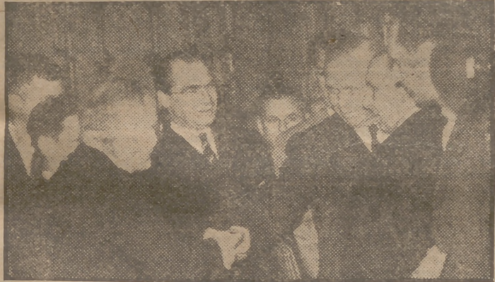
Marshall, el secretario de Estado norteamericano, al dar comienzo una de las sesiones de la Conferencia de Londres para la discusión de los Tratados de paz con Alemania y Austria.