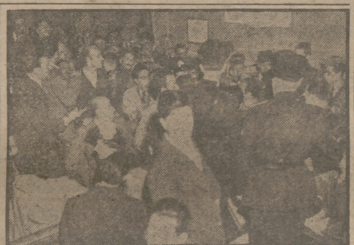
También Roma, la población, pasa lo suyo. Los comunistas, como se aprecia en la foto, asaltan las Jefaturas de Policía, como sus camaradas de París.

El profesor Fuldignoni y la psicología en el arte