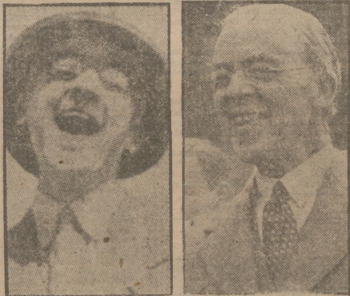
ASI RIE SIR STAFFORD CRIPPS

Q UIEN es Cripps? ¿Un político 100 por 100 o un santo desinteresado de las materialidades de la vida? Ningún hombre en la vida política de los últimos años ha suscitado tantas controversias como "sir" Stafford Cripps. Los lectores le recordarán, durante la segunda guerra mundial, lanzado por el Gobierno británico a distintos puntos del Globo con misiones leídasísimas. Ya entonces se le señalaba como una de las primeras figuras del país. Tras un pasajero eclipse, debido acaso a su poca fortuna en el problema indio, Cripps retorna a la actualidad con nueva ascensión meteórica. Hoy es el hombre encargado—nada a menos—de resolver la crisis económica británica y se le tiene por el candidato más seguro a la sucesión del primer ministro Attlee.