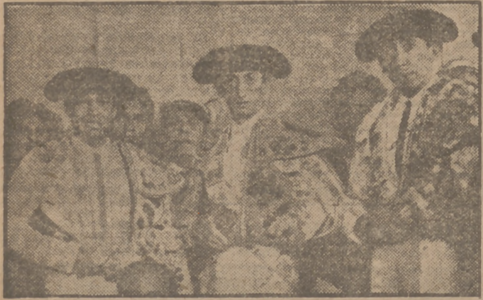
Manolete dispuesto a hacer el paseíllo en una Plaza mejicana con Armillita y Felipe González, diestros aztecos.

De Gieza va Manolete al Puerto de Santa María. Otro alboroto, y el 29, en Linares, nuevo triunfo. El 30 destacan en el ruedo que sería trágico para "el Monstruo" los toreros anunciados con el de Córdoba. El Estudiante y Pepe Luis cortan orejas a los toros de Braganza. El 31, último día de agosto, hay en Cádiz corrida de gran altura. El caballero Domecq, toros de la ganadería propiedad suya y de sus hermanos, y de maestros a pie, Ortega, Manolete y Arruza. La espuma de la afición sevillana en los ten-