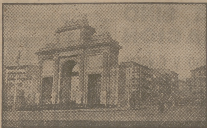
La Puerta de Toledo, que será el final del trazado de la nueva Gran Vía, que arrancará de la plaza de San Francisco, cuya obra acometerá el Ayuntamiento muy en breve.

Los arquitectos han estudiado su reforma