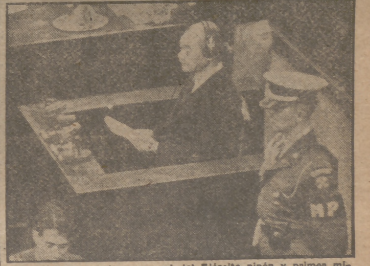
Kuniaki Koiso, antiguo general del Ejército nipón y primer ministro del Gobierno japonés desde julio de 1944 a abril de 1945, ha comparecido ante el Tribunal Militar Internacional de Tokio, y él mismo se encargó de su defensa.