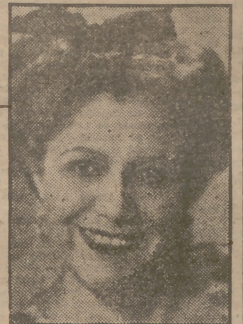
La primera actriz del Reina Victoria.

Torrado aporta nuevos detalles y matices que añaden más motivos de comicidad a la comedia en cartel del Reina Victoria.