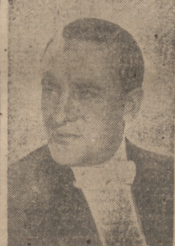
George Sanders, protagonista de "El retrato de Dorian Gray", película basada en la célebre novela del mismo título del escritor inglés Oscar Wilde y que hoy se estrena en el Palacio de la Prensa.