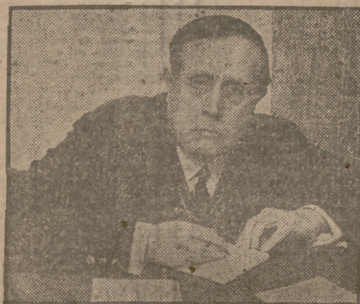
Don José Martínez Ruiz, "Azorín", en la época en que fué subsecretario de Instrucción Pública.