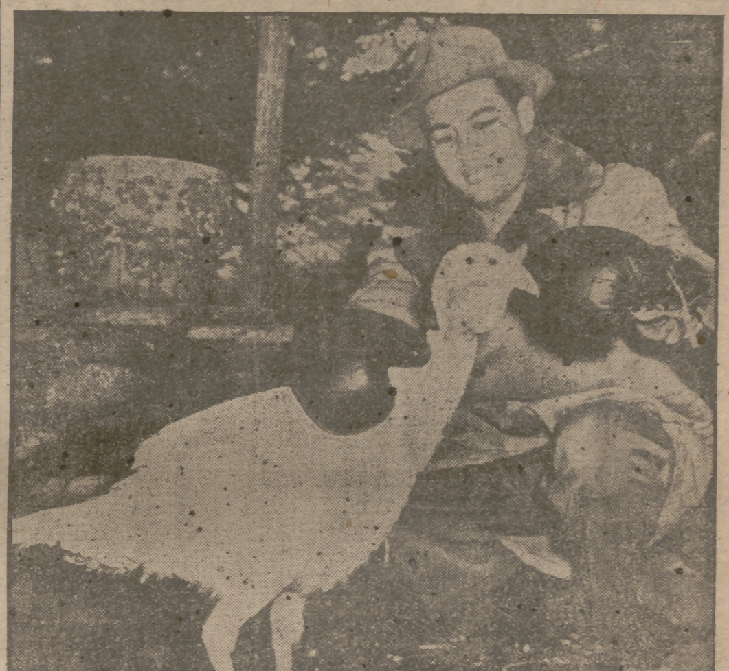
Joe Louis se prepara en Pompton Lakes para su próximo combate con Joe Walcott. Joe, el bueno; se ha dejado retratar así, con este pavo, el que aplica en gancho de izquierda. La escena parece predecir el porvenir que espera al otro Joe.