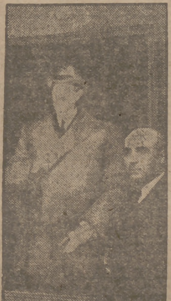
"Azorín" pintado por Vázquez Díaz. Junto al retrato, su autor.

ella escribe... "La lamparilla vi gigante la apago al hacerse el día. Y sigo trabajando." Como este calor del braserío no basta —ya hemos dicho lo friolero que es el escritor—, escribe con el abrigo puesto. Y ya tenemos aquí la pequeña ambición del escritor. El hubiera deseado ser secretario perpetuo de la Real Academia de la Lengua. ¿Por los honores, por la vanidad del cargo...? No. Por algo más sencillo: hubiera tenido unas habitaciones con calefacción.