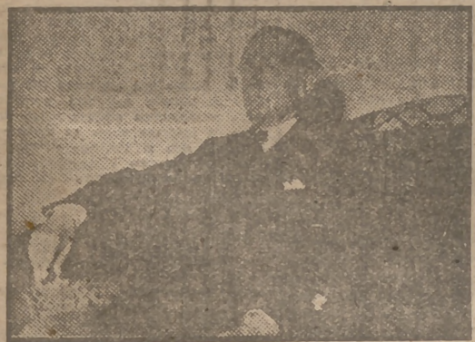
A la izquierda, "Azorín" fotografiado en su casa. A la derecha, el retrato de "Azorín" por Zuloaga, una de las últimas obras del ilustre pintor.

Y ha escrito un original libro sobre toros. Una novela con "truco". Todos los personajes, incluido el protagonista, son imaginarios. Pero hay un personaje que existe, y ese es precisamente el que carece de existencia. Es un espectro, un fantasma. Es lo que él llama la sombra del torero. Sombra que se apodera del lidiador, que lo domina y persigue, que cambia su vida en dos mitades. El verdadero nombre de la sombra no se conoce hasta las últimas líneas de la novela. Y ese es el truco. Embutido en su gabán, con la cabeza casi perdida entre las solapas, con sus gafas muy intelectuales pero nada toreras, Marquería nos muestra gráficamente cómo a los toros se les puede toroar con razones, con palabras. Su figura no es aquí muy gallarda ni muy torera, y nosotros tenemos el miedo que si a los toros es posible convencer con palabras, no sé, no sé si al público que ha pagado su entrada se le convencerá también con los mismos argumentos. Y éste creo yo es el "truco" de esta fotografía. Que sólo al final de la prueba se sabría el resultado. "El torero y su sombra" tiene una técnica narrativa doble: las dos o tres descripciones de corridas que hay en el libro se hacen de un modo exaltado e imaginístico. Y el resto de los capítulos es un relato normal, con normales diálogos. El protagonista, Juan Toledano, es un buen tipo racial. La intervención de una mujer de la clase media en la vida del torero es una de las grandes originalidades de esta novela.