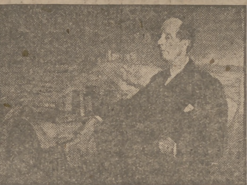
"Azorín" era así en su juventud.

EL HUBIERA QUERIDO ser secretario de la Academia El escritor de los 5.000 ejemplares