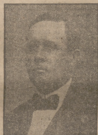
"Azorín" era así en su juventud.

N ACIO el escritor en 1874. Si Dios quiere, dentro de poco cumplirá los setenta y cinco años. Para conmemorar el cumpleaños del escritor han organizado un homenaje los editores y libreros madrileños. Aquí, en España, donde no se extingue un día sin que haya su correspondiente celebración, se suele olvidar tales fechas. Generalmente se compensa la ingratitud en vida con la estatua del escritor muerto. En tanto llega o no llega este póstumo recuerdo, el escritor vive atribulado por diarias azorías. Tremenda prueba la de la profesión literaria. Dentro de poco el escritor tendrá setenta y cinco años. Ha trabajado mucho, ha escrito millares de cuartillas. A lo largo de cincuenta años no hizo otra cosa. En los diarios, en las revistas ha publicado centenares de artículos. Su labor es muy copiosa. Sus obras se han editado múltiples veces y ha logrado popularizar su nombre. También el escritor ha probado escribir para el teatro. Ahora, a los setenta y tantos años, sigue escribiendo diariamente con la misma intensidad que cuando tenía veinte.