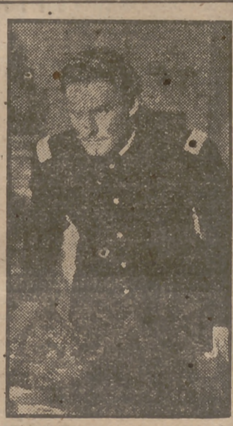
Errol Flynn en un momento de la maravillosa película de la Warner Bros "Murieron con las botas puestas", film que con el mayor de los éxitos de público ha entrado en su segunda semana de proyección en el cine Avenida.