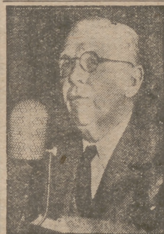
Petición de Marshall

¿Quién es Ana Pauker? Contada a grandes rasgos, su accidentada biografía es la siguiente: Nació en 1889; cuenta, pues, en la actualidad, cincuenta y ocho años. Su padre era un rabino de Moldavia. Comenzó la carrera de Medicina, profesión que atravesó mucho a la mujer rumana, pero la dejó por la política, a las diecisiete años, para convertirse en una agitadora revolucionaria, lo que le deparó la cárcel primero y después el exilio. La clásica peripetia de todo miembro activo del partido comunista.