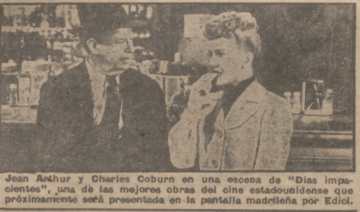
Jean Arthur y Charles Coburn en una escena de "Días impacientes", una de las mejores obras del cine estadounidense que próximamente será presentada en la pantalla madrileña por Edici.