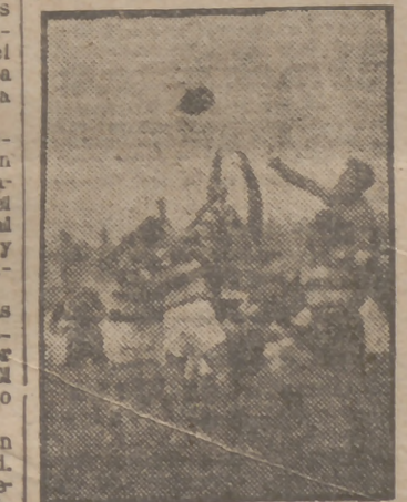
Arquitectura y Derecho jugaron ayer el encuentro de rugby regional, terminado favorablemente para los arquitectos.

Alineaciones: Sabadell. — Pujol; Vilaseca.