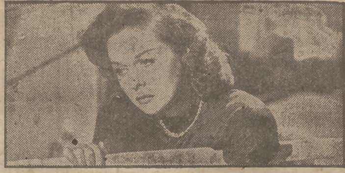
Susan Hayward en un primer plano de "Una mujer destruida", espectacular y emocionante película que hoy se estrena en el cine Avenida.

El día 2 embarcó en el "Magallanes", que partió de Cádiz. Lieve buen viaje este excelente actor y buen amigo.