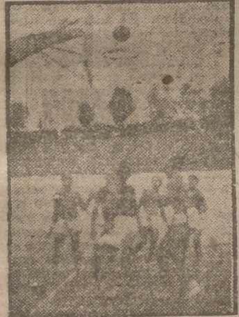
Un momento del partido Canoe-Standard, del campeonato regional, y que fué favorable para los nadadores.