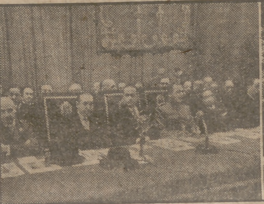
Hoy ha sido inaugurado el Congreso Nacional de Sanidad, bajo la presidencia del ministro de la Gobernación. Ofrecemos aquí dos aspectos del acto inaugural: la mesa presidencial y los asistentes. Información en páginas interiores.

UNOS NIÑOS POLACOS VAN Y OTROS VIENEN Ganaron doce kilos de peso en España