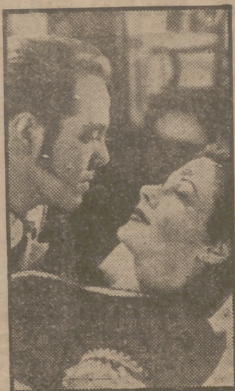
Hedy Lamarr y Larris Hayward en una escena del film "Extraña mujer", que en breve se estrenará en Madrid.

JUEVES, ESTRENO de este magnífico superfilm en COLISEVM