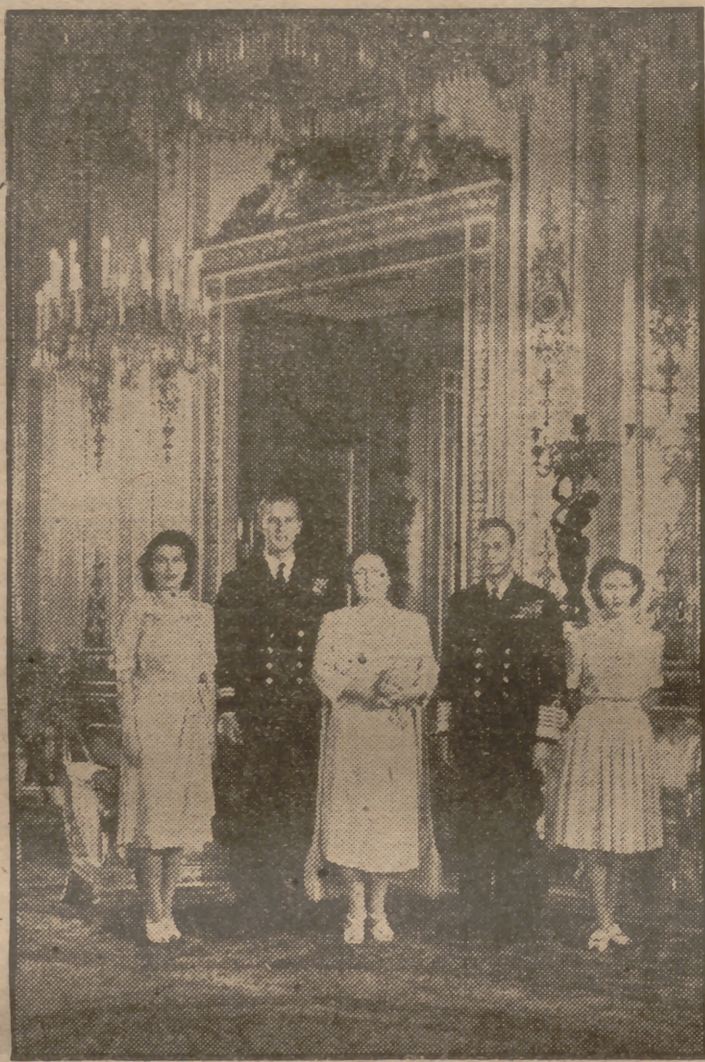
Los Reyes Jorge e Isabel de Inglaterra, con su hija mayor, la princesa Isabel; el prometido de ésta, teniente de navío Felipe Mountbatten, y la princesa Margarita, posan ante el fotógrafo en el salón blanco del palacio de Buckingham. La boda de la heredera del Trono británico se celebrará el próximo 20 de noviembre.

Ese 20 de noviembre, fecha de la boda de Elizabeth y el teniente Mountbatten, los invitados a la ceremonia en Westminster serán obsequiados después en Buckingham con refrescos y "sandwiches". Nada de banquetes. Los camareros pasarán sus bandejas con naranjadas y bocadillos entre los grupos "a pie". Esto, que avergonzaría a cualquier estraperlista de no importa dónde, será una perla, la más preciada, que abrigará la diadema de novia de la princesita inglesa.