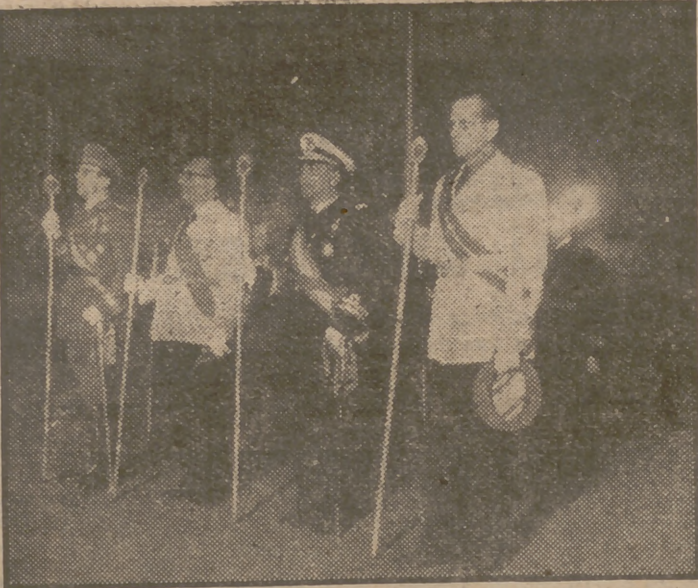
Los ministros de Marina y Educación Nacional y los gobernadores civil y militar de Madrid presidieron la procesión de Lepanto, celebrada ayer tarde.

Terminado el desfile de la procesión ante el palacio de Santa Cruz, y al abandonar el balcón Su Excelencia el Jefe del Estado y Generalísimo de los Ejércitos, acompañado de su esposa y del Gobierno, la muchedumbre prorrumió en sus aclamaciones a Franco y en sus aplausos, acrecentándose estas manifestaciones de entusiasmo cuando después abandonaba Su Excelencia, a las nueve de la noche, el palacio de Santa Cruz, siendo seguido largo tiempo por el afecto ostentóramente expresado por la multitud, que no cesó durante el recorrido de Su Excelencia de regreso al Palacio. Las fuerzas militares, al salir el Caudillo con su esposa del edificio, rindieron nuevamente los honores, interpretándose el Himno nacional. El Gobierno se despidió de Su Excelencia en la misma plaza, y durante todos estos actos el público no cesó en sus entusiásticos aplausos y aclamaciones.