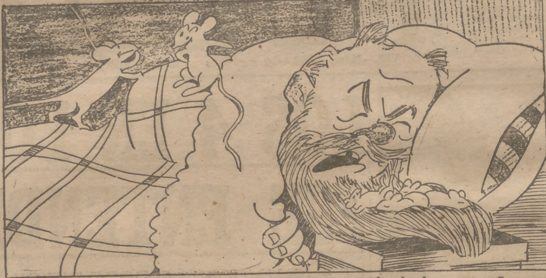
—Ve usted, señora de Ratez. Vivir en una casa donde hay un señor con barbas es una delicia para dormir los pequeñuelos...