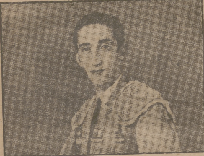
Fotografía de Manolete, obtenida en sus tiempos de novillero principiante.

Los tres espadas matan ese día novillos de Miura. Las dos orejas y el rabo de su primer toro pasan a las manos de Ma-