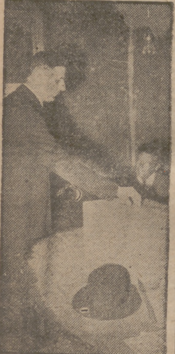
El general De Gaulle deposita su voto en la urna en el distrito de Colombey-les-Deux-Eglises, con motivo del plebiscito para la Constitución francesa.

Es sabido que en una Academia Militar nadie se escapa sin su correspondiente mote "ad hoc". El de nuestro hombre necesariamente tenía que aludir a su elevada estatura, a su estrado cuello y a su delgadez. En efecto, para los burlescos cadetes de Saint-Cyr De Gaulle fue "el gran espárrago". Durante su aprovechada estancia en la famosa "incubadora" de mariscales de Francia la estatura del cadete de Lila rompió irremediablemente la armonía y proporción de las formaciones, suprema preocupación de los oficiales instructores. La cabeza del cadete De Gaulle sobresalía un metro por encima de las de sus compañeros. Era como el campanario de una iglesia sobre las achaparradas casitas de un pueblo bretón.