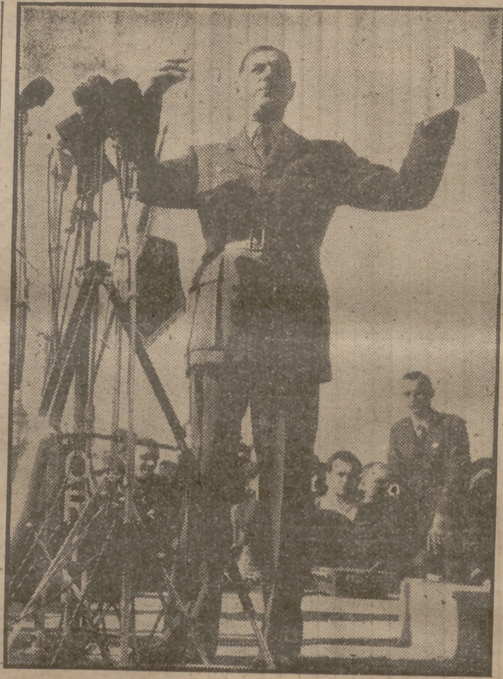
El general De Gaulle en un momento del discurso que pronunció en ocasión de la colocación de la primera piedra del monumento en las costas de Bruneval en memoria de las fuerzas que realizaron el primer desembarco en 1942 contra los alemanes.

beben y fuman copiosamente, haciendo justamente lo contrario a lo recomendado para tener una voz clara y bien timbrada.