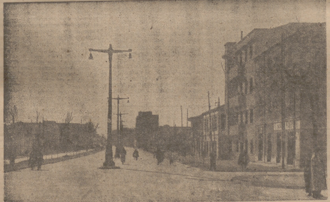
AVENIDA DE VALLADOLID