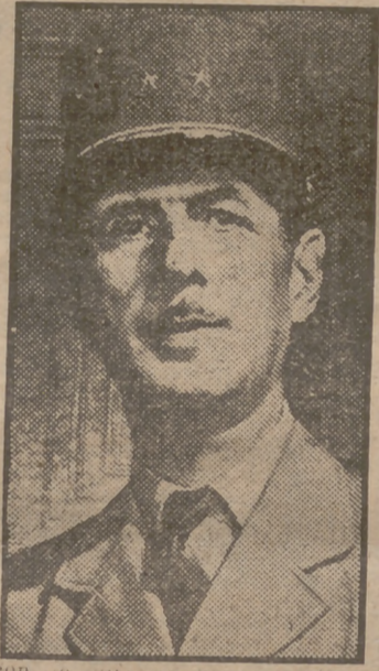
Con lo que se hace un buen discurso. Es curioso pensar que todos los destacados oradores de nuestro tiempo—y hay que contar a De Gaulle entre ellos—

De Gaulle. Dicho número oscila entre los cuarenta—dos cajetillas—y ciento ochenta—nueve cajetillas—. De todas formas hay que estar en posesión de unos pulmones de amianto para resistir tantos quintales de nicotina. El cigarrillo es tan eterno en sus labios como el puro en los de Winston S. Churchill. El general sólo fuma un puro después de las comidas, acompañándose del consabido coñac "Fines Napoléon". El almuerzo lo riega habitualmente con un viejo borgoña tinto, que bebe en cantidades proporcionales a su corpulencia. También, como su amigo Winston, piensa seguramente que no es con agua