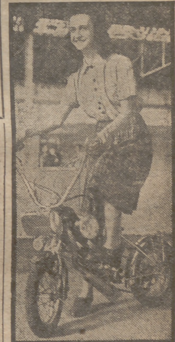
Esta pequeña motocicleta ha ganado el concurso anual de los inventores franceses en la Exposición celebrada en el Parque de París. A primera vista parece que la muchacha deportiva va montada en un clervo; pero la verdad es que la máquina es cómoda y útil, no obstante su aspecto ortopédico.