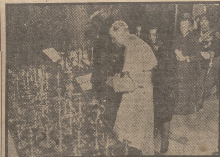
Su Santidad el Papa, Pío XII, examina un envío de los niños españoles que consiste en variados objetos de culto, hasta 220 libras de oro y plata, para distribuir entre las iglesias afectadas por la devastación de la guerra. La entrega fue hecha el día 11 por las Damas Españolas, cuya delegada aparece inmediatamente detrás del Pontífice. (Foto A. P.)

VIENA, 16.—La "Roca del Hambre", en el lago de Mondsee, cerca de Salzburgo, ha quedado al descubierto al descender considerablemente el nivel del agua, debido a la sequía. Es tradición entre los habitantes de la región que cuando se va la roca el hambre azota fatalmente a todos los pueblos de los alrededores. La sequía ha paralizado en gran medida la navegación por el Danubio. Todos los grandes transportes de Viena al mar Negro han cesado por completo. En Viena, el nivel del Danubio ha descendido quince centímetros, cosa que no se conocía desde hace diez años. (Efe.)