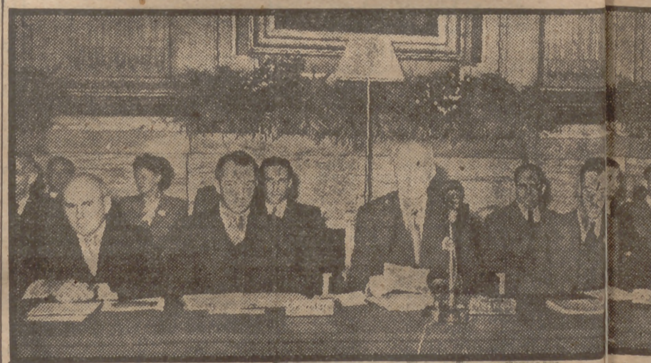
La segunda reunión anual de la Conferencia Internacional Monetaria en el despacho de los gobernadores del Banco Internacional para la Reconstrucción y el Desarrollo Económico.