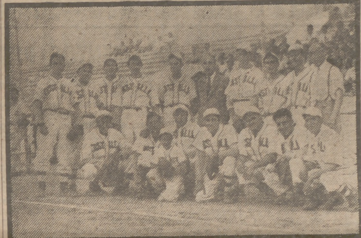
La selección de pelota base representativa de Castilla, que ha resultado vencedora de la selección catalana por dos victorias...