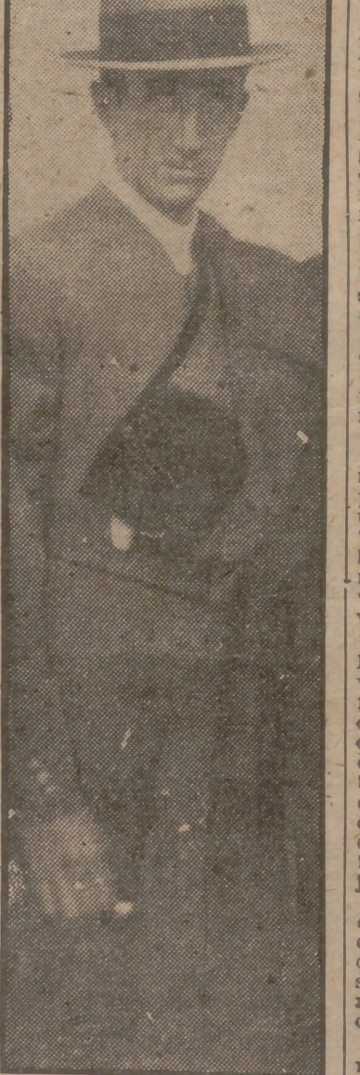
Manolete, con traje campero, dispuesto a torear un festival benéfico en la Plaza de Córdoba.

Todos hablan, todos vociferan, todos se apabullan con fantásticas proezas, y sólo Manuel Rodríguez Sánchez está callado, una sonrisa irónica en su boca.