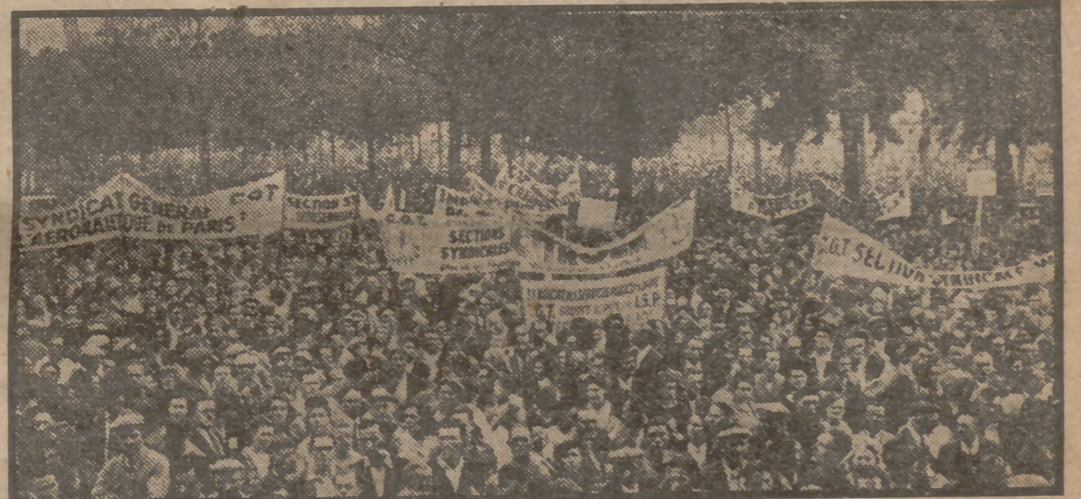
Mitin monstruo en el campo de Marte. En la vecina Francia, los Sindicatos protestan contra las restricciones anunciadas por el Gobierno, manifestándose con banderas y pancartas.