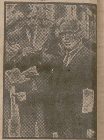
El ministro inglés de Carburantes, Mr. Shinwell, llega al Ministerio para celebrar una conferencia con los miembros de la Unión Nacional de Mineros y tratar de poner fin a la huelga de las minas de carbón en la zona del Yorkshire.