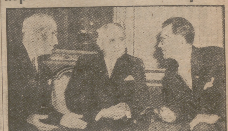
A su llegada a Rio de Janeiro, Truman fue recibido por Dutra, Presidente del Brasil, en cuya residencia mantuvieron conversaciones sobre la política panamericana. Les acompañó el embajador yanqui en Rio, que figura a la derecha del grabado. En la Conferencia de Defensa Interamericana de Petrópolis, el Presidente Truman dió suficiente claridad al afán imperialista de la Rusia soviética. Estas fueron sus palabras: "La postguerra nos ha traído una amarga desazón. Existen naciones que aún aspiran a ese tipo de dominación en el Extranjero contra la cual hemos luchado durante años."