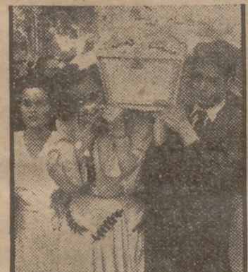
Se ha efectuado el entierro de las víctimas por la explosión, ocurrida el sábado en Alcalá de Henares. Presidieron el ministro de la Gobernación, don Blas Pérez González; el capitán general de la primera región, general Muñoz Grandes, y la Corporación Municipal bajo mazas.