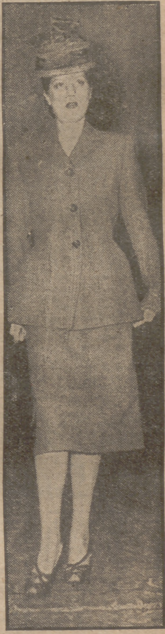
Este es el último modelo para otoño lanzado en Roma.

Podemos asegurar que por primera vez en la historia, la mujer, que hasta aquí se había sometido dócilmente a la esclavitud de la moda, se ha rebelado contra la dictadura de los figurinistas, árbitros de la elegancia femenina. La crisis de las dictaduras se ha ampliado. (Continúa en págs. centrales.)