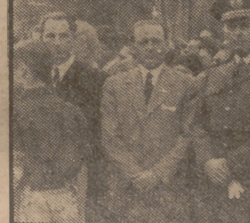
Información en la página 3.