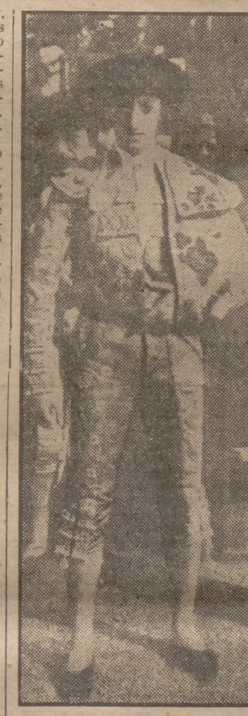
Manolete con el traje de luces.

uno; blanca, verde y negra—ay, divisa mireñal—la del otro. Sus cueros musculados con rellenos son potentes, y las orejas tensas parecen avizorar el momento de una arrancada, que en las Plazas puede ser el ¡olé! admirativo o el ¡ay! de la muerte. —No, mi hijo no será torero... ¡No lo será! Y el hondo dolor materno tiene un epílogo humano y humorístico. Manolo, con sigilo, abandona el cuarto camino de la calle cuando hacía rato que se calmaron los gritos y lágrimas de la madre. Angustias sorprende al fugitivo. Una escoba en sus manos, y el rapazuelo, ante el diluvio de escobazos, se refugia debajo de la cama. La chaquetilla torera le sirve de parapeto. Pero la indignación de la madre rompe las defensas y las costillas del futuro diestro con sacudidas de polvo, aunque el de la escoba se le quede a ráfagas sobre la vestimenta. Corre el chichuelo hacia la puerta. Le sigue la madre. Correteando por el patio, estremeciéndose las cabezas de "Sardinero" y "Botinero". Algún escobazo roza el lacio pelo nevado del toro dual y la capa cárdena del enrazado con sangre del "Sardinero" y de Santa Coloma.