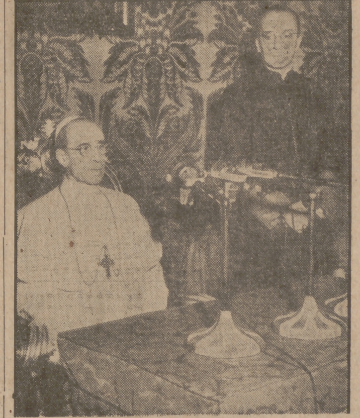
Fotografía tomada a Su Santidad Pío XII durante la radiación de un mensaje que dirigió a los niños de los Estados Unidos

tiempo. Las organizaciones católicas han sido disueltas por los mismos obispos por miedo que la Policía secreta se apoderase de las listas de miembros y aplicara medidas de castigo contra los mismos. También han tenido que cerrar la mayoría de los seminarios y parte de ellos siguen ocupados por tropas de partisanos. Junto con el arzobispo Stépinac se encuentran actualmente doscientos curas y tres vicarios generales en