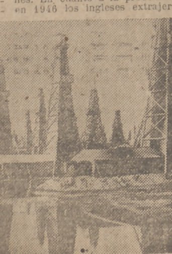
Los pozos petrolíferos en el Oriente Medio son una de las principales fuentes de riqueza. Me aquí un campo petrolífero donde se puede apreciar numerosos pozos productores del preciado líquido.

Al principio de 1946 los ingleses poseían cerca de 19.000 millones de toneladas de los recursos petrolíferos investigados en el Oriente Próximo, y los norteamericanos, unos 15 millones. En cuanto a la producción, en 1946 los ingleses extrajeron