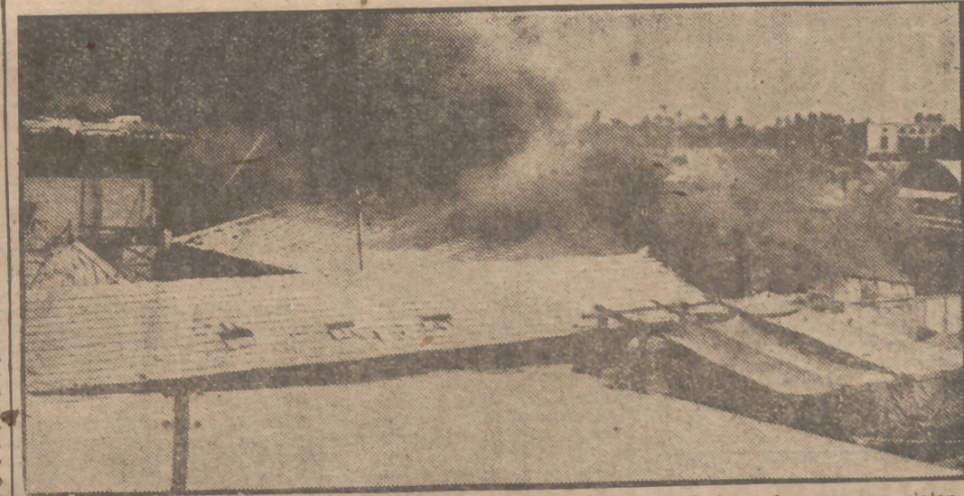
Las poblaciones de Tel Aviv y Jaffa, compuestas por Judios y árabes, chocaron con violencia el día 14 de agosto. Cuatro árabes y un judío resultaron muertos. Las fuerzas inglesas hubieron de formar una barrera para evitar nuevas colisiones. Una fábrica judía arde a consecuencia de la acción de los árabes.