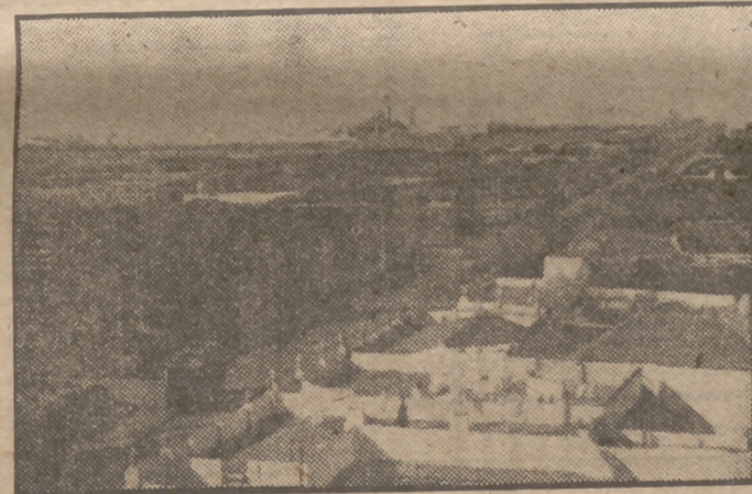
Vista parcial de Puería de Tierra, en cuyas inmediaciones se ha producido la catástrofe

El incendio se corrió al depósito de defensas submarinas donde estallaron numerosas minas SOLO HA SIDO AFECTADO el barrio de San Severiano EL NUMERO DE VICTIMAS ES ELEVADO Y LOS DAÑOS SON CONSIDERABLES