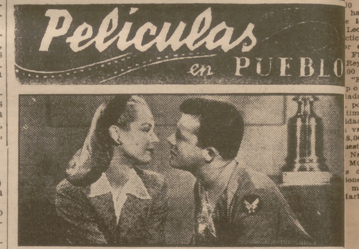
Una interesante escena de la película "Cita en los Cielos", cuyo estreno se anuncia para fecha próxima en el Coliseum.

Voy. — Continúa 5: El colliero de Boston y Enamorados (Jeanette Mac Donal).