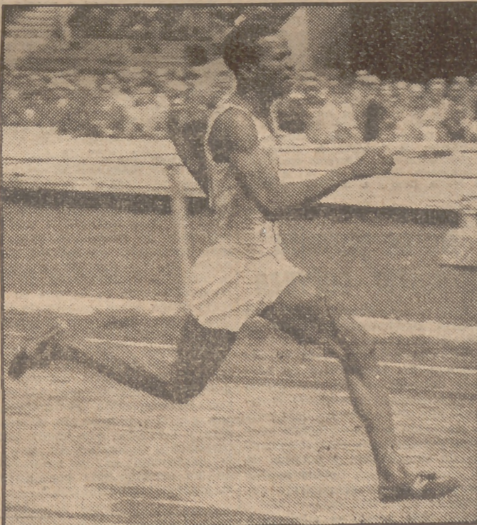
E. McDonald Bailey, jamaquino, en la carrera de 100 yardas en el campeonato disputado en el Estadio de White City, Londres, el día 19 de este mes. Bailey hizo el recorrido en 9 minutos 9 segundos.