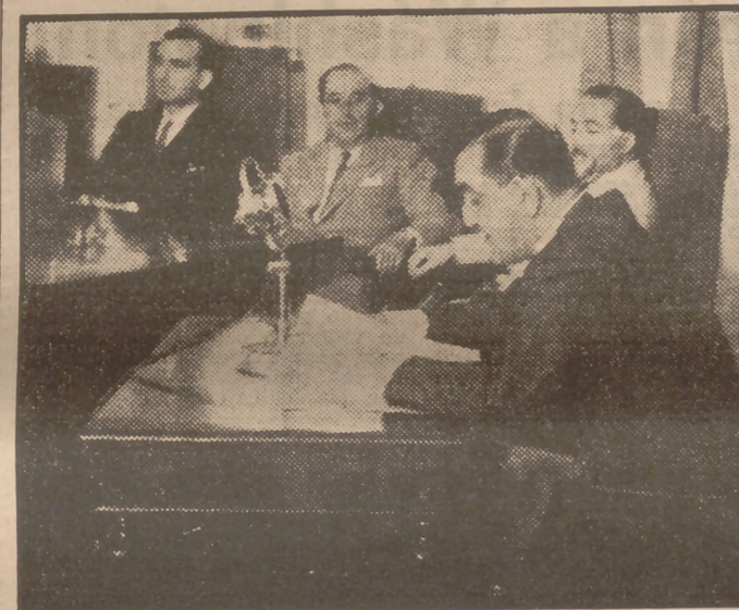
La fotografía nos muestra un momento durante la conferencia del vicepresidente de la Cámara argentina, señor Díaz de Vivar, en el Instituto de Cultura Hispánica de Madrid.

Cuadernos colectivos Se notifica a todos los titulares de cuadernos colectivos de Madrid y provincia que las liquidaciones y canje de tarjetas complementarias de suministro se efectuarán en estas oficinas (San Bernardo, 21), en los días que a continuación se indican, de una y media a una y media: Día 26.—Restaurantes, tabernas y bodegones de los distritos del Centro, Hospicio y Chamberí. Día 28.—Restaurantes, tabernas y bodegones de los distritos del Congreso, Buenavista y Hospital,