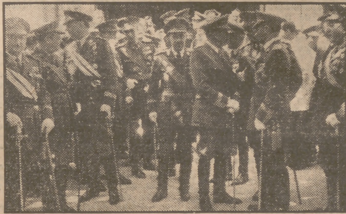
Con motivo de la festividad del Apóstol Santiago, Patrón de España, se celebró un solemne acto religioso en la iglesia de Buen Suceso, con asistencia del capitán general de Madrid y otras autoridades, efectuándose a continuación un desfile ante éstas por fuerzas de Caballería. Arma que hoy también conmemora la festividad de su Patrón.

España conmemora fervorosamente la festividad de su Santo Patrón