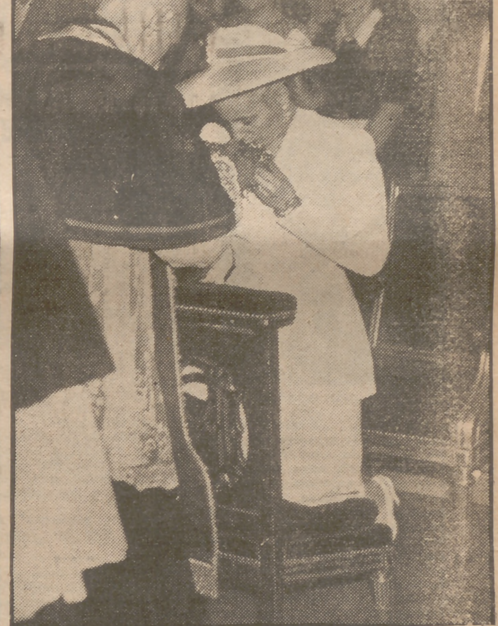
María Eva Duarte de Perón, esposa del Presidente de la Argentina, besa las sagradas reliquias de la Catedral de Notre Dame, en París.

Un muchacho de catorce años le regaló una bufanda confeccionada por él