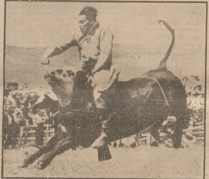
Un momento de gran emoción en el rodeo que se celebra todos los veranos en Morley, Alberta, en el Canadá. El indio, jinete sobre un toro, parece dispuesto a propinar un puñetazo al animal para apagarle los bríos.