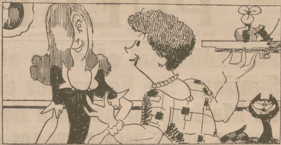
—Fíjate si es una mujer de suerte que una vez que iba cansadísima, una señora anciana le cedió su asiento en el tranvía lleno...