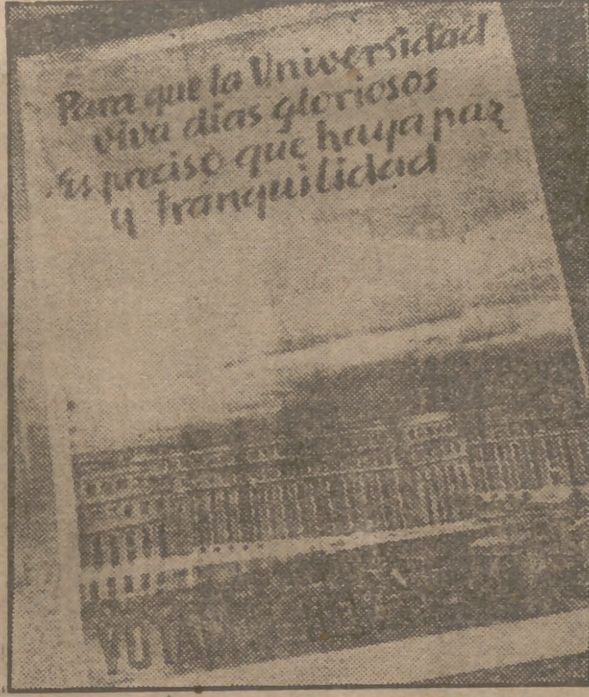
En las fachadas de los edificios madrileños aparecen con profusión carteles como éstos, que dicen: "¡OBREROS! Franco ha construido para ti 13.127 viviendas y se están construyendo 14.000.—TU DEBER ES VOTAR CON UN SI EL REFERENDUM." "Para que la Universidad viva días gloriosos es preciso que haya paz y tranquilidad: VOTAD EL REFERENDUM".