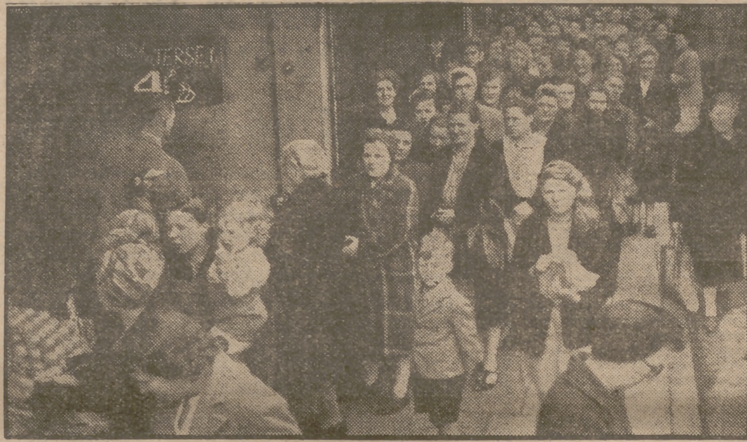
La falta de patatas en el mercado londinense ha provocado la formación de largas colas ante los establecimientos. Véase esta cola en que cada componente va con la ilusión de conseguir el kilo del rico tubérculo que le corresponde como racionamiento.