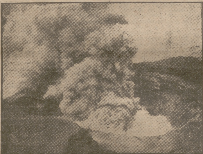
Enormes masas de humo del Monte Aso. Poco después el volcán japonés, situado en el Kyushu Central, empezó a arrojar lava. Este volcán está en erupción a intervalos regulares desde el año 553 antes de Jesucristo.