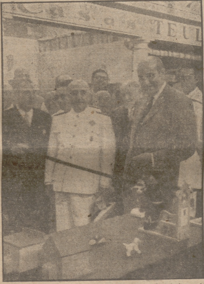
Su Excelencia el Jefe del Estado recorre las instalaciones de la Feria Internacional de Muestras de Barcelona.

En uno de los espléndidos salones del Palacio del Senado, estos modestos comerciantes de ultramarinos esperan el momento de la inauguración de su Asamblea, que es la primera que celebran.