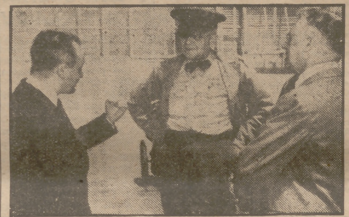
El cónsul general de Méjico en los Angeles protesta ante el jefe de la Policía de Aduanas por lo que él llamó "descoartesia" hacia el ministro de Estado de su país, que, acompañado de su esposa, fué recluido tras una cerca de alambre mientras se procedía al registro aduanero de sus equipajes.