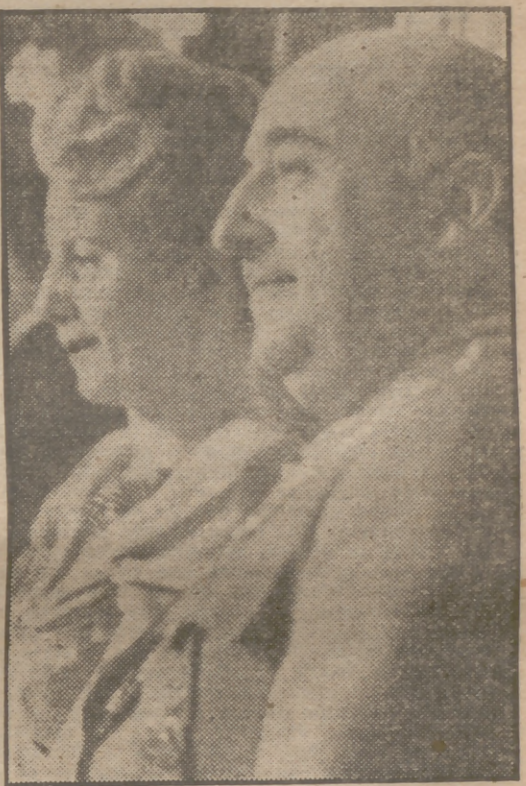
El Caudillo acompaña a la ilustre dama argentina durante uno de los festivales organizados en honor de la esposa del general Perón, en Barcelona.

A las 4 menos 10 el avión volaba hacia Roma