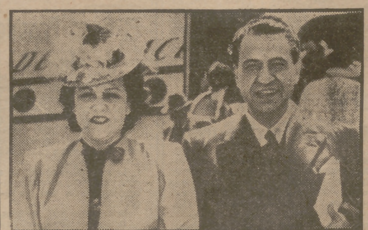
El ministro mejicano don Jaime Bodet, con su esposa, en el momento de abandonar el avión que les llevó a los Angeles.