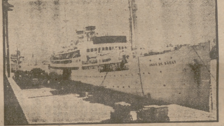
El transatlántico argentino "Juan de Garay", al llegar al puerto de Santa Cruz de Tenerife en su primer viaje Buenos Aires-Río de Janeiro-Cádiz-Barcelona y Génova.

El gobernador civil y autoridades locales.