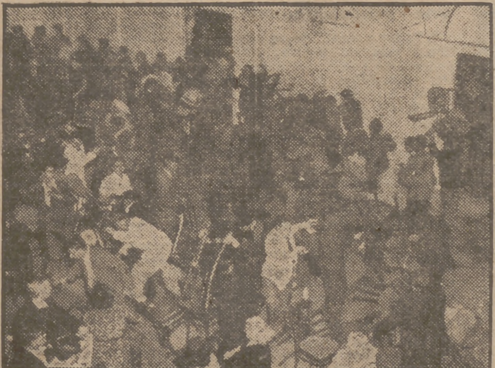
Unos 150 comunistas, provistos de porras, entraron en el local en que se celebraba un mitin del partido Szabadsag (Libertad), en Szeged, Hungría. (Los asistentes al mitin repelieron la agresión a silletazos.)