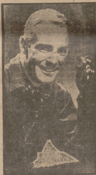
Randolph Scott, uno de los galanes favoritos del público neoyorquino, es protagonista de "¡Todos a una!", grandiosa superproducción del cine americano que Cea presentará muy pronto al público madrileño.

La razón de ello nos la dan Charles Boyer, Adolfo Menjou, Jean Gabin, Julián Duvivier, Claudette Colbert, Maurice Chevallier, Danielle Darrieux, Simone Simon, todos ellos franceses, que no pudieron resistir la tentación de cruzar el "charco", y allí están suspirando por París... pero con residencia fija en Hollywood. Creemos que el estreno en España de "L'Idiot" no se hará esperar mucho, y entonces nosotros ratificaremos o rectificaremos el criterio de los magnates del cine estadounidense.