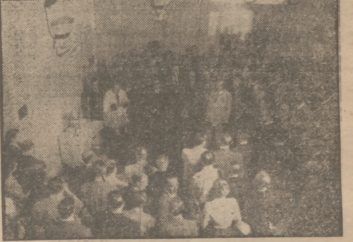
Momento de la bendición de la nueva Jefatura Provincial de Sanidad, inaugurada esta mañana con asistencia del ministro de la Gobernación, gobernador civil y otras autoridades.