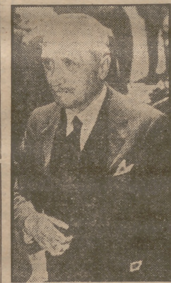
ENRIQUE DE NICOLA

ROMA, 26 (1,55 t.).—La Asamblea italiana ha reelegido Presidente a Enrico De Nicola. De un total de 431 votos han votado por la reelección de De Nicola 405. (Efe.)