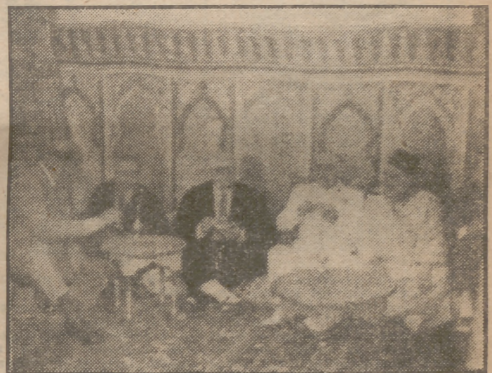
En el pabellón marroquí de la Feria Internacional de Muestras de Barcelona, el Generalísimo es invitado a una taza de té.

A las tres en punto de la tarde han abandonado el palacio de Pedralbes para dirigirse al aeródromo del Prat, donde tomará el avión que debe conducirlo a Roma, la esposa del Presidente argentino, acompañada de Su Excelencia el jefe del Estado, esposa e hija. El primer coche de la comitiva oficial ha sido ocupado por el jefe del