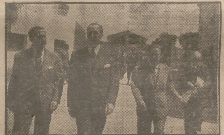
El ministro de Agricultura, señor Rein, acompañado de altas personalidades, durante la visita que hizo a la colonia agrícola de Santa María del Valle, en Barcelona.

Los premios de los juegos florales bético-lusitanos. Donativo del ministro de la Gobernación a los pobres de Tarragona.—El servicio aéreo Santiago-Madrid.—El aeródromo de Santiago de Compostela.—El paso de la Virgen de Fátima por Salamanca.—El ministro de Educación Nacional, en la Universidad de Barcelona.—Ante la visita de la esposa del Presidente Perón.