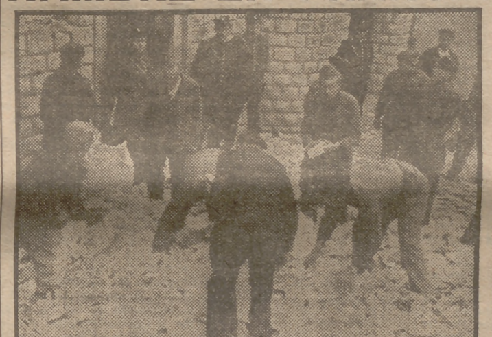
Una muchedumbre hambrienta asaltó la oficina de racionamiento de Dijon el día 20 de mayo. Las cartillas fueron desparramadas por los suelos y la Policía y algunos voluntarios se ocuparon de recoger los restos.