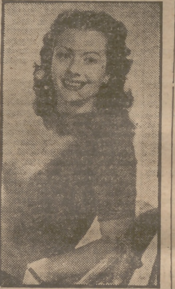
Margaret Lockwood, bellísima actriz británica, una de las más solicitadas por los estudios de Hollywood; la veremos muy pronto como protagonista del film de gran éxito "Historia de amor", que será presentada por Distribuidora Chamartín.