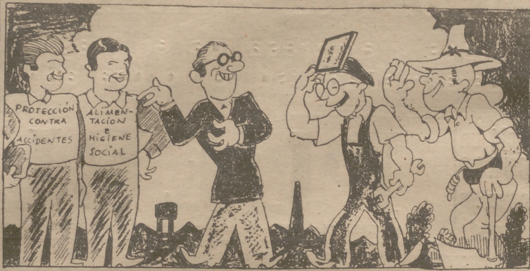
—Aquí tenéis dos excelentes amigos que quiero estén siempre con vosotros.