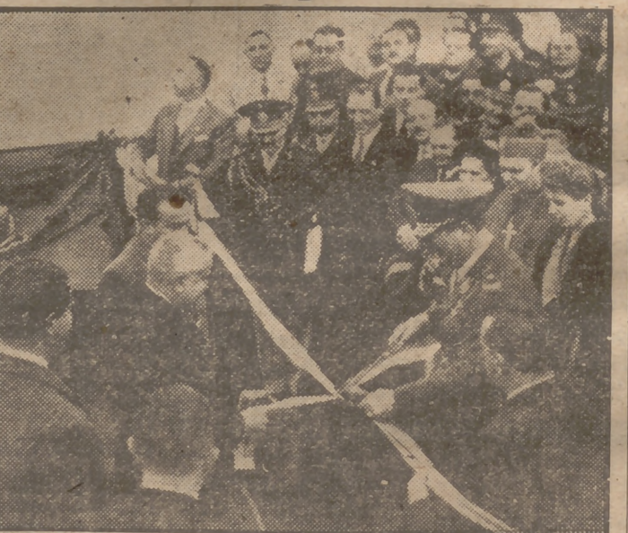
El Presidente del Brasil, general Dutra, y el Presidente de la Argentina, general J. D. Perón, en el momento de cortar la cinta con motivo de la inauguración del Puente Internacional, que unirá a los países en Paso de los Libres.