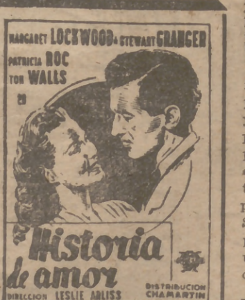
El extraño encuentro de dos seres atormentados por un terrible secreto.

"El espectro de la rosa" Así llaman a Ben Hecht en algunos medios de Hollywood; pero si él está loco, el resto de la colonia cinematográfica debía padecer de la misma enfermedad, porque es una clase de demencia que le hace producir maravillas. Sus argumentos cinematográficos ("Cumbres borrascosas" y "Recuerda"); sus innovaciones en la radio y en la pantalla... La última prueba de polifacetismo la ha dado con "EL ESPECTRO DE LA ROSA", su primera película para "Republic", en la que ha intervenido como autor del guión, productor y director, y de la que se tienen referencias de obra maestra del cine psicológico.