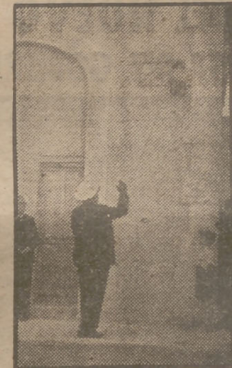
Momento en que el almirante Bastarache descubre la láplida que da el nombre de Cervantes al paseo del Puerto de Denia. (Foto Cifra.)

SEVILLA, 28 (1 t.).—Esta mañana han marchado, para esperar a las carretas del Rocío, numerosas carrozas y coches adornados al estilo típico andaluz y con grupos de muchachas que visten trajes rocleros. Llegarán hasta más allá del pueblo de Castilleja de la Cuesta, y allí aguardarán el retorno de la Hermandad del Rocío de Triana, que arribará a dicho barrio esta noche, a las once. Este año el recibimiento a las carretas del Rocío será apoteósico. La mayoría de las casas de las calles del barrio de Triana han sido adornadas con artísticos tapices y emblemas alusivos a la devoción de Sevilla y Triana por la Virgen del Rocío. (Cifra.)