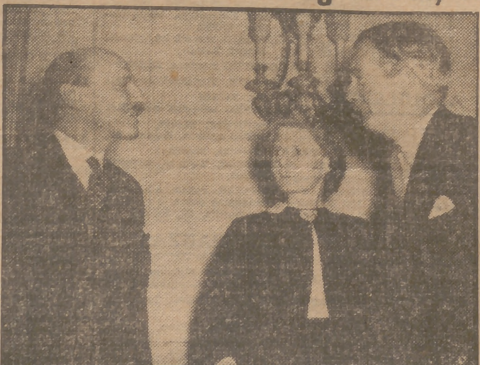
En la residencia oficial de Mr. Attlee se celebró una reunión de miembros distinguidos de la política y la aristocracia. He aquí al matrimonio Attlee en compañía de Mr. Eden.