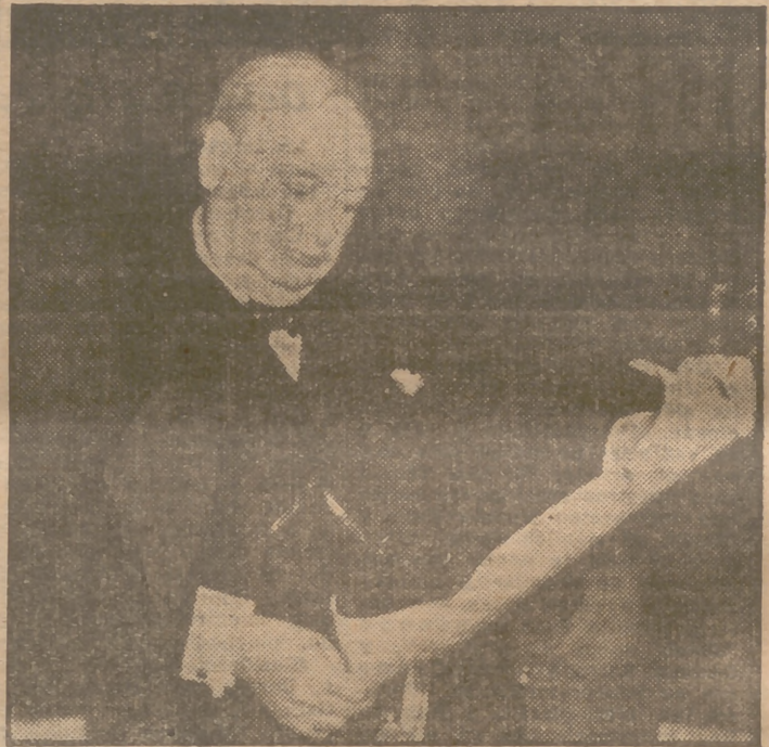
Churchill, primer ministro de Inglaterra en tiempos de guerra, es nombrado ciudadano honorario del condado de Darlington. En la foto aparece leyendo el pergamino en que se le confiere el nombramiento.