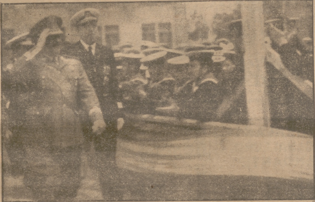
He aquí uno de los momentos del viaje triunfal de S. E. el Jefe del Estado por Valencia y su provincia. Franco, después de inaugurar la Feria Internacional de Muestras, estuvo en los astilleros de la Unión Naval de Levante, donde asistió a la bendición de un buque que pronto será botado.