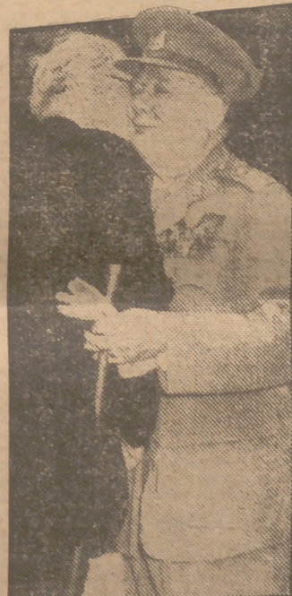
Winston Churchill ha recibido de manos de Ramadier la Medalla Militar, que es la más alta recompensa francesa. Después de la entrega, Ramadier besó al salvador de Europa entre las ovaciones del público.