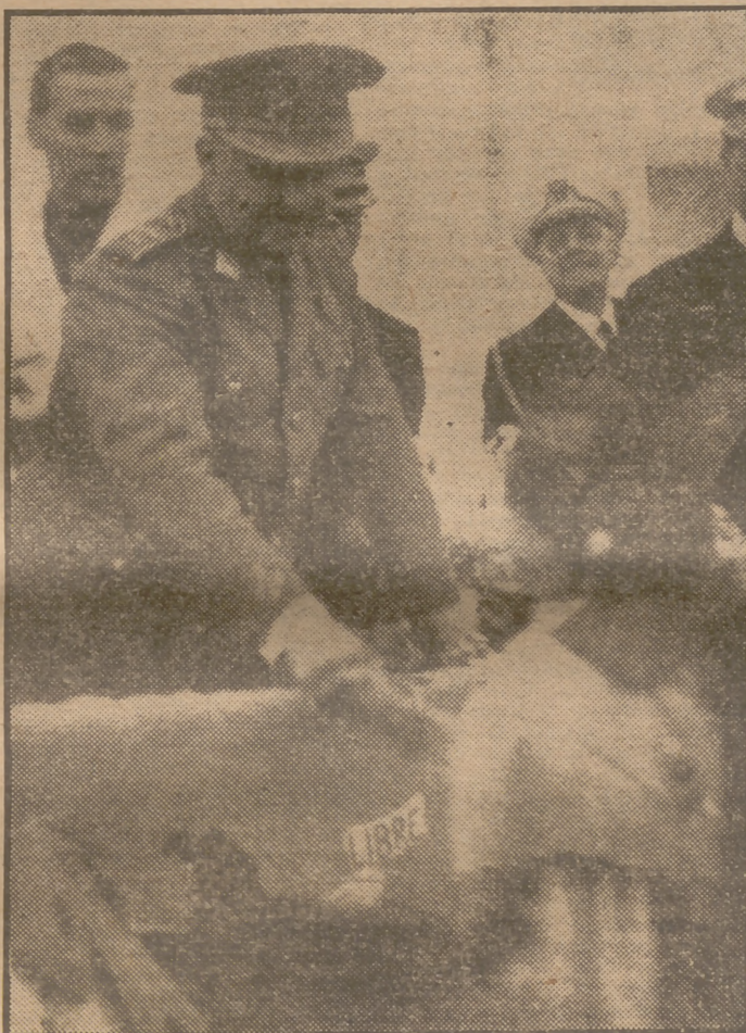
Los huertanos de Valencia hicieron una ofrenda de frutos de la tierra a Su Excelencia el Jefe del Estado. En la foto aparece el Caudillo en el instante de recibir una muestra del campo del levantino de manos de una bella muchacha ataviada con el traje típico del país.

A pesar de la lluvia, numerosos grupos han permanecido durante toda la mañana ante el palacio de Benicarló, en espera de una ocasión para ver al Caudillo y mostrarle, una vez más, su adhesión. Los grupos estacionados no cesaron de aplaudir y vitorear al Generalísimo Franco.