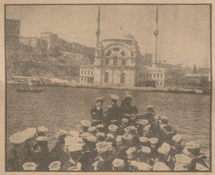
La escuadra norteamericana que se halla en aguas mediterráneas... para que se entere Rusia ha hecho escala en Estambul. He aquí la primera embarcación que transporta a tierra a parte de la tripulación de una de las grandes unidades. Al fondo, una mezzquita recorta su silueta clásica.

Goethe habla de sus enemigos y los clasifica. Van en primer lugar los enemigos por "estupidez", que son los que no entienden y censuran sin conocer la obra ni el hombre. En segundo lugar van los más numerosos, los que viven bajo el suplicio de la "envidia", los que no perdonan el talento de los demás, los que no perdonan las posiciones que se conquistan por el propio esfuerzo. Después cita el gran pensador a los enemigos que menos daño le hacen, los que disparan sobre la persona cuando ésta queda a muchos kilómetros de distancia. Don Ramón Serrano Suñer ha escrito un libro, que verá la luz el jueves o viernes de esta se-