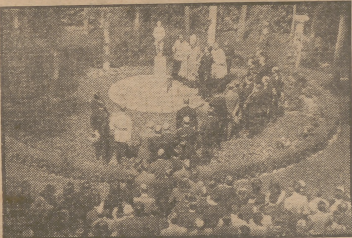
El patriarca de las Indias, obispo de Madrid-Alcalá; el ministro de Agricultura y otras autoridades, durante la ceremonia de la bendición de la imagen de San Isidro en el jardín del edificio central del Instituto Nacional de Colonización. (Información en última página.)