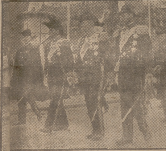
En la foto, de izquierda a derecha, figuraban el Rey Cristián X, el Rey Federico de Dinamarca y los príncipes Grete y Knud de Dinamarca.