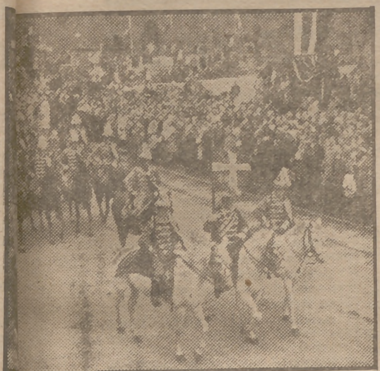
El día un pueblo quedó reflejado en el desfile de la boda del Rey Cristián X de Dinamarca el momento de hacerse amar de sus súbditos. Más de 750.000 personas recorrieron el cortejo por las calles de Copenhague.