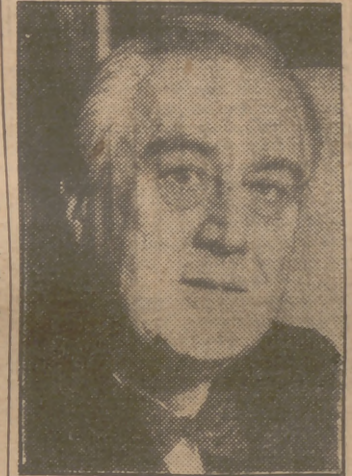
HYDE PARK (Nueva York, 12 (5.12 t.).—Millares de personas de todos los puntos de la nación (Continúa en págs. centrales.)