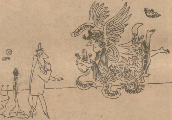
La "obra de jabón" irrumpe en los estudios de "radio".

Una de las protagonistas de esta historia tuvo un niño—en la novela, naturalmente—. A los pocos días el Estudio se inundaba de zapatitos y jerseys enviados por las radioyentes para ese hijo del éter. Cuando un personaje de cierta novela llamada "Bachelor's Children" sufrió un ataque de amnesia, hasta el punto de que no podía recordar