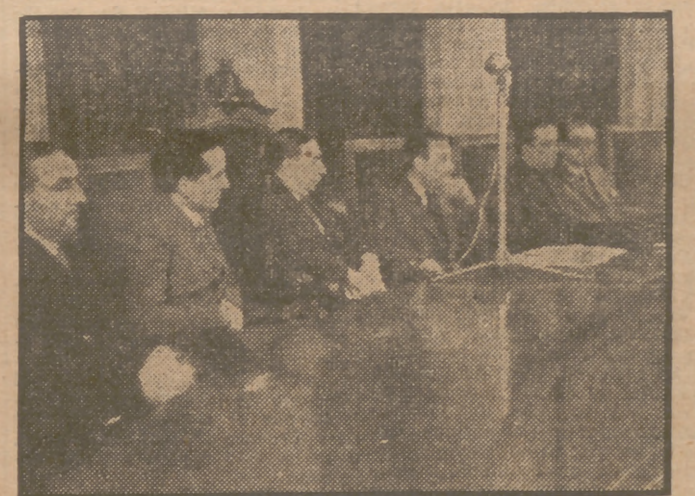
Presidencia del Congreso de Obras Sindicales que se ha celebrado en Barcelona.

El Delegado Nacional de Sindicatos, en Martorell.—Estudiantes de Zurich visitan Segovia.—Los arqueólogos suizos examinan pinturas rupestres en Castellón.—Visita a las industrias de las zonas tinerfeñas.—Para los damnificados de Sevilla.—Detención de un "rata de hotel".—Intereses remolacheros de Granada.—La casa de Jovellanos, al Estado.—El doctor Castroviejo visita al doctor Barraquer.—Atracadores muertos por la Guardia Civil.