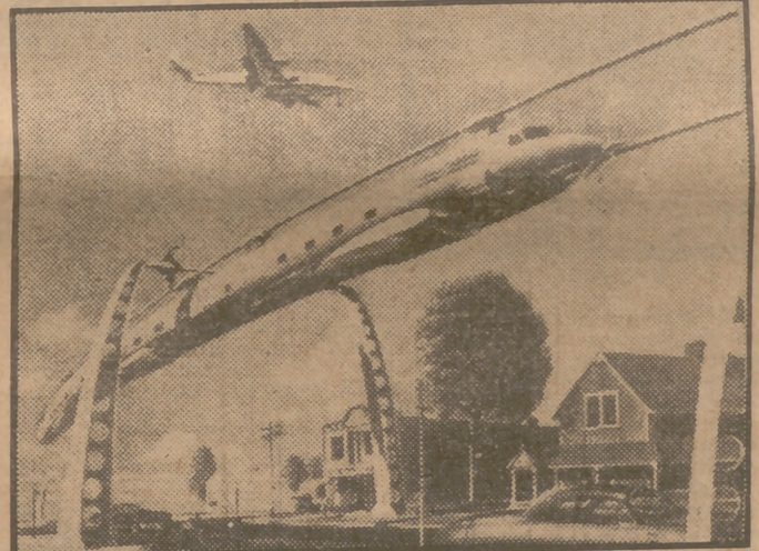
Un especialista en proyectos futuristas, Rabendaus, del Nuevo Centro de Estudios de Detroit (Estados Unidos) ha diseñado este tren elevado movido a hélice, que comunicará los aeropuertos de una ciudad del mañana entre sí para que los pasajeros lleguen a tiempo de coger los enlaces.