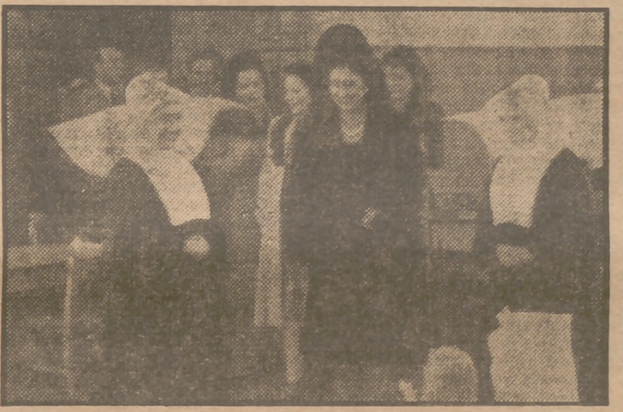
La esposa del Caudillo visita la Casa-Hogar de Nuestra Señora de la Victoria, donde la Diputación Provincial tiene acogidos doscientos niños pobres.

Congreso de Obras Sindicales en Barcelona. Concurso semanal de ganados en Valladolid. Continúa sus tareas el Congreso de las ciencias.