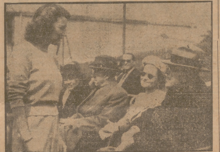
La figura venerable del Rey Gustavo de Suecia es conocida de todos los deportistas del mundo, especialmente de los habituales concurrentes a los "cocerts" de tenis más famosos. He aquí al Rey Gustavo, en charla con miss Pauline Betz, que resultaría vencedora en el torneo de Carlton.