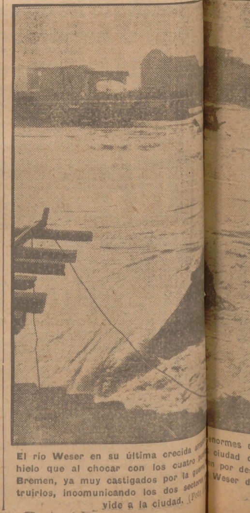
El río Weser en su última crecida de hielo al chocar con los cuatro puentes de Bremen, ya muy castigados por los truenos, inoportunando los dos sectores de la ciudad.