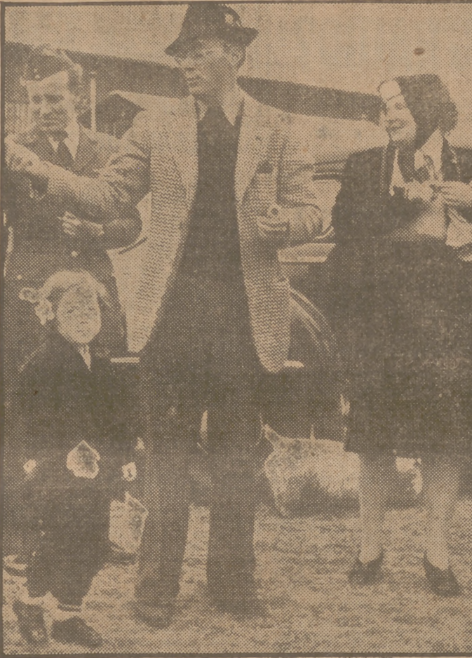
La princesa Juliana de Holanda y su hija, de cuatro años, princesa Margarita, llegan a Suiza con el príncipe Bernardo para pasar una temporada.