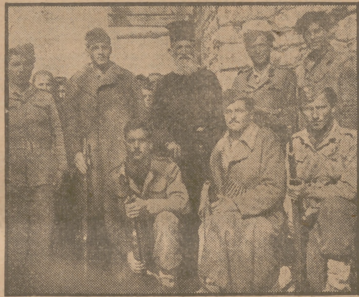
La Comisión de Investigación de fronteras en Grecia había quedado citada con el general partisano "Marcos" en el pueblecito de Kastanofiton. Allí encontraron a guerrilleros que posaron junto al párroco del pueblo, pero el general "Marcos" no se dignó asistir.