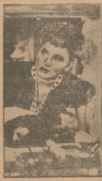
Jean Arthur vuelve a la pantalla en una moderna y divertida comedia cinematográfica que lleva por título "El amor llamó dos veces" y que muy pronto se estrenará en Madrid presentada por Edici. Junto a esta bellísima actriz actúan el apuesto galán Joe Mac Crea y el gracioso actor de carácter Charles Coburn. "El amor llamó dos veces" es un verdadero derroche de gracia picaresca, de sabroso ingenio, originalidad y esplendor escénicos.

de los films producidos por Enterprise Productions en todos los países del mundo, a excepción de Canadá y Estados Unidos. La necesidad de llegar a este feliz acuerdo se comprenderá fácilmente si se tiene en cuenta que Enterprise Productions ha llegado a ser la más importante Compañía de las que dedican sus actividades al mercado internacional, y que Loew's International Corporation es, a su vez, la primera distribuidora del mundo. Se trata, pues, de unir las actividades de las "dos grandes" en beneficio de la industria y del comercio cinematográficos y con el objeto de servir más eficazmente al público de todos los países.