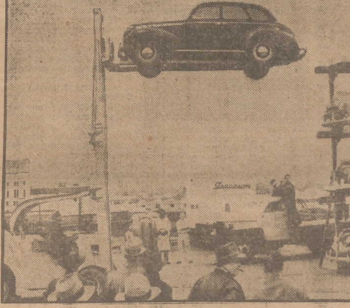
Una Sociedad de Washington ha probado con éxito este nuevo método de aparcamiento. Una grúa especial eleva al coche para colocarlo en el estante de esa "automovilera". En la operación se tardan menos de dos minutos.