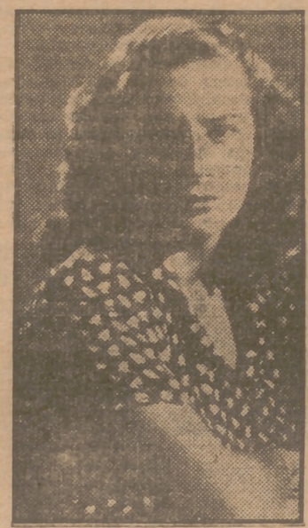
La excelente actriz Alida Valli, en "La vida vuelve a empezar", su última película realizada en Europa y cuyo triunfo le valió su contrato en Hollywood. Presentada por Cifesa en el cine Rialto, obtiene uno de los mayores éxitos cinematográficos de la Gran Vía madrileña.