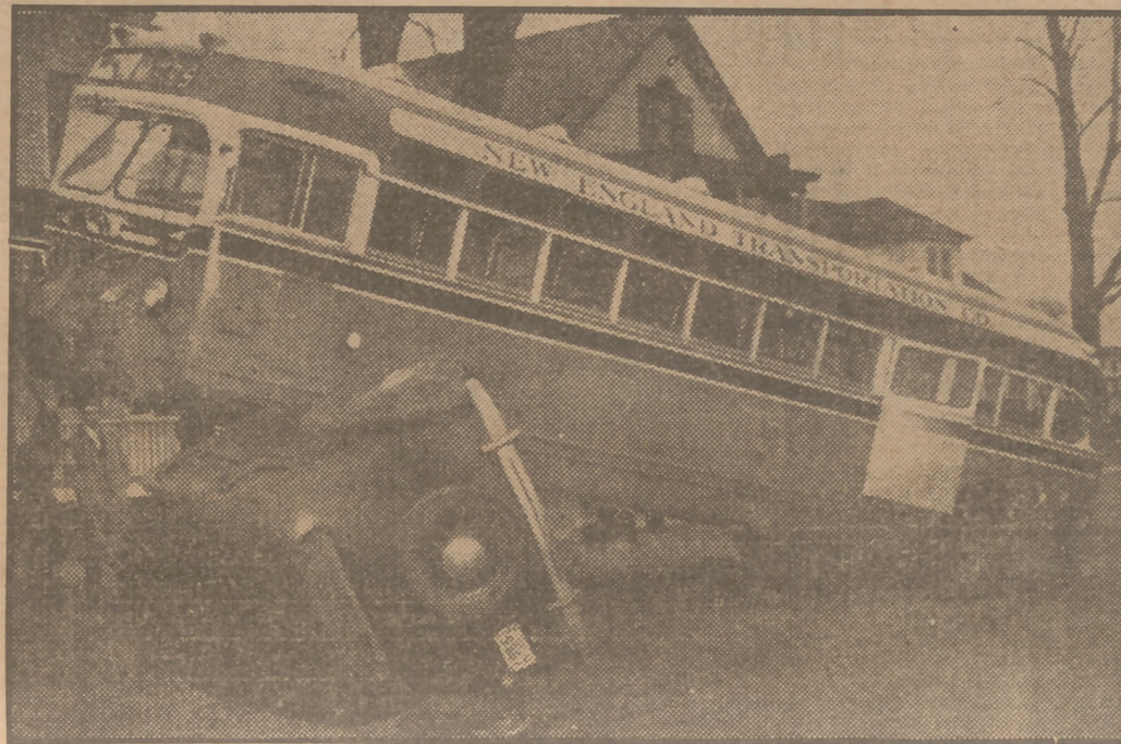
En Thompsonville (Estados Unidos) un autobús lleno de viajeros atropelló a un cochecito. El conductor de éste fué la única víctima y sólo resultó ligeramente lesionado pese a lo apor- tado del accidente.